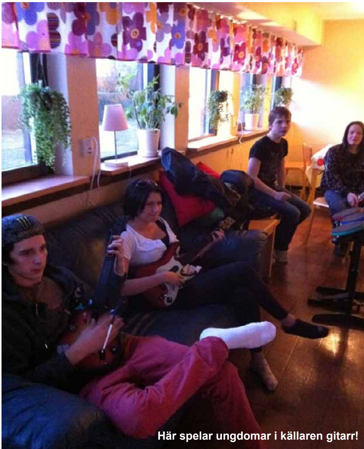
Här spelar ungdomar i källaren gitarr!