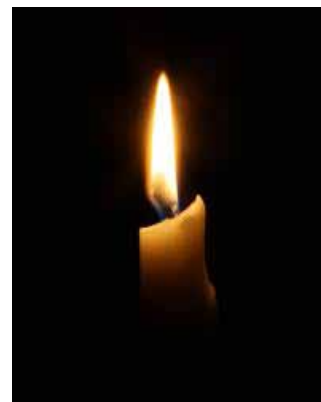
av Karin Långström Vinge präst i Skövde pastorat