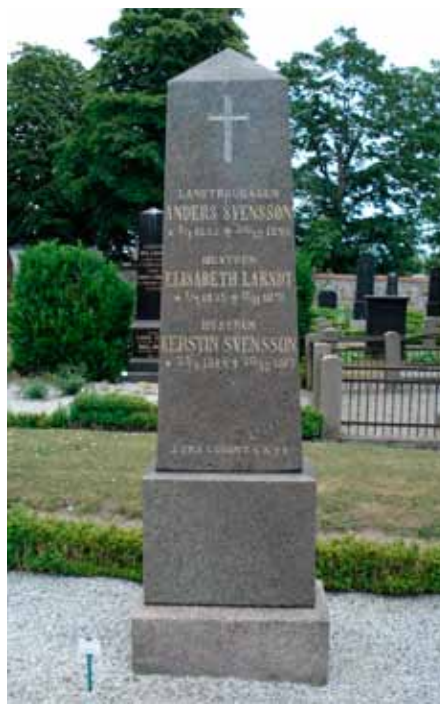
Obelisk och den obeliskliknande stenen var vanliga från 1840-tal till 1920-tal. De är uppbyggda i tre delar, har kvadratisk eller rektangulärt tvärsnitt och pyramid-formad eller bruten topp. T.v. Burlövs gamla kyrka, t.h. Hjårsås kyrka.