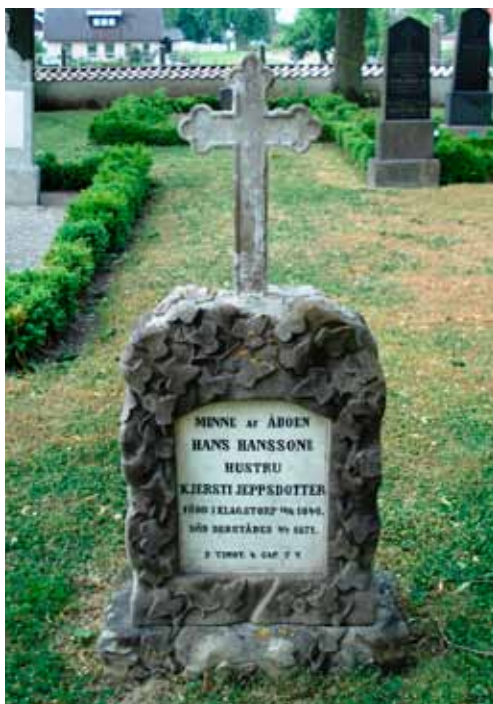
Låg naturromantisk sten med infälld textplatta och kors i marmor, vanlig från 1830-tal till 1880-tal. Västra Klagstorps kyrka.