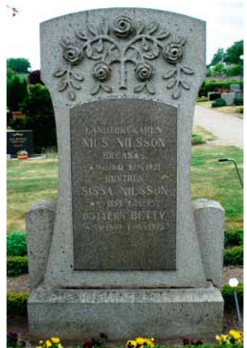
Stora stenar i jugendstil fanns ca 1910 till 1925. Art Nouveau eller Jugend var inte sällan asymmetrisk och full av vridna rankor och växtmotiv.