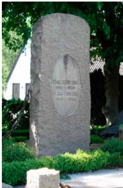
Stora, grovhuggna stenar i granit var ett mode från ca 1880-talet och framåt. Nationalromantiskt inspirerade av förhistoriska "bautastenar" kunde de nå enorma proportioner. Till bautastenen hörde vanligen en stor, konstfullt inhägnad gravplats.