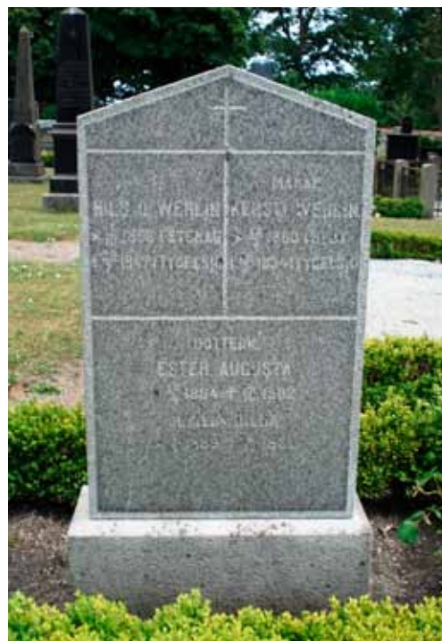
Sparsmakat utformade stenar som är högre än de är breda var vanliga från 1930- till 1950-tal. Tygelsjö.