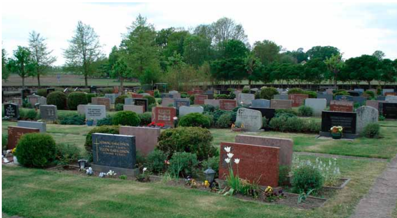
Gravkvarter från 1960- och 70-tal på Hjårsås kyrkogård.