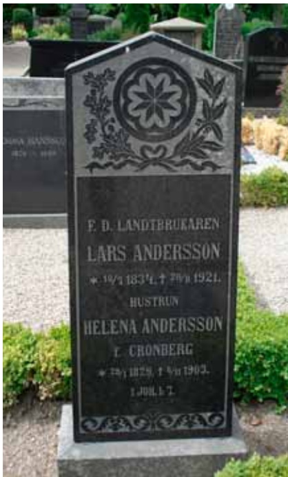
Från 1890- till 1910-tal var den absolut vanligaste stenen i svart diabas med polering. Med tiden fick de också blåstrad dekor. Väsby.