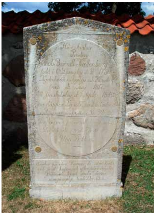
Stående kalkstenshäll vid Tygelsjö kyrka, 1828.

Från omkring 1830- till 1840-tal dök två nya typer av stenar upp på de studerade kyrkogårdarna. Den ena var obeliskens, också den en klassisk form med anor från antikens Egypten. Den andra var en liten naturromantisk sten i blandade material, som ofta bar ett litet kors och en infälld textplatta i marmor. Att fälla in detaljer i marmor eller biskviporslin var vanligt från 1800-talets mitt fram till ca 1890. En vanlig infälld detalj var t.ex. den runda medaljongen i biskviporslin med klassicistiskt motiv i relief. Ytterligare en influens som gjorde sig gällande från 1860-tal till 1880-tal var inspirationen från medeltiden, framförallt gotiken och gotiska fönster. Vid samma tid kom också de första