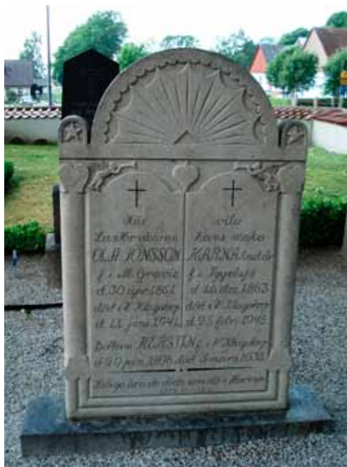
Nya stenar i gammal stil dök upp under 1910- till 1930-tal. Denna från 1940-talet är till exempel tydligt inspirerad av de gamla, skånska, stående kalkstenshällarna. Västra Klagstorp.