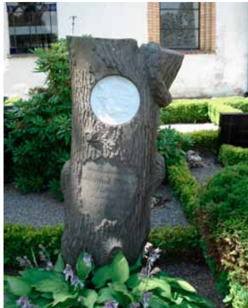
Kolonnen förekom sparsamt men regelbundet från 1860- till 1910-tal. Den brutna kolonnen är en typisk klassicistisk form, men också en symbol för det avbrutna livet. Den avbrutna trädstammen förekom från 1860-tal till ca 1900. Den har i stort samma symboliska betydelse men i en mer naturromantisk tradition. Båda från Väsby kyrka.