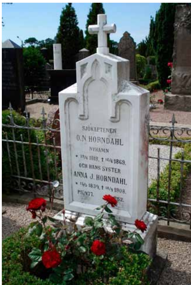
Tydligt gotiskt inspirerade former förekom från 1850- till 1880-tal. Ofta påminner stenarna om gotiska fönster, i antingen tvådelat eller tredelat utförande. T.v. Brunby kyrka, t.h. Väsby kyrka.