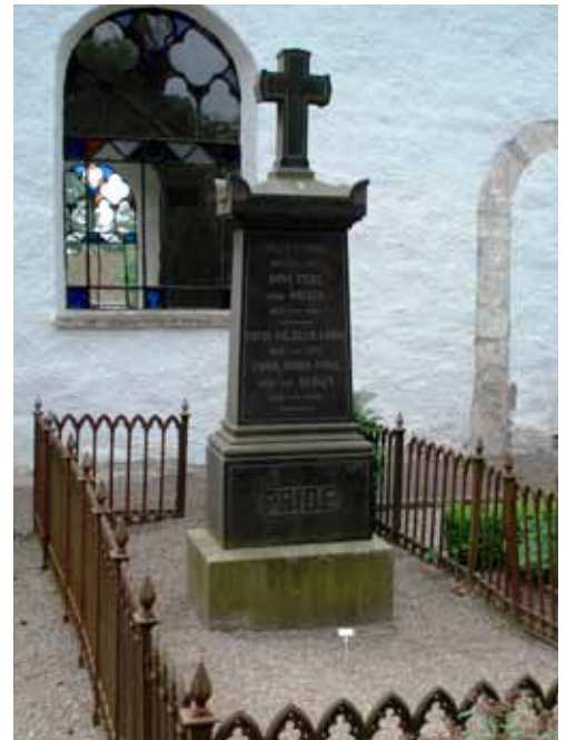
Stora kors och andra monumentala stenar i polerad svart granit blev vanliga under 1890-talet. Väsby.