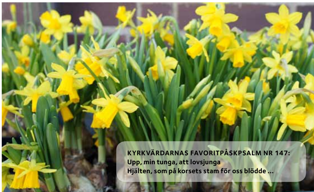
KYRKVÄRDARNAS FAVORITPÅSKPSALM NR 147: Upp, min tunga, att lovsjunga Hjälten, som på korsets stam för oss blödde ...