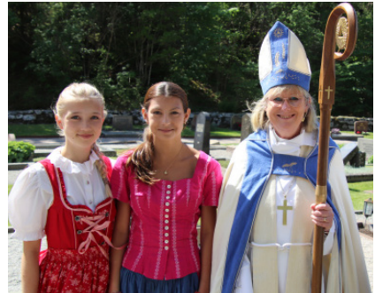
Biskopen med sångare ur Rosetterna