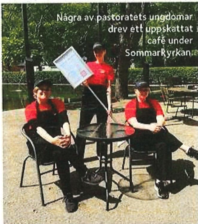
Några av pastoratets ungdomar drev ett uppskattat café under SommarKyrkan.