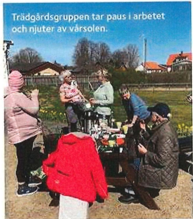
Trädgårdsgruppen tar paus i arbetet och njuter av vårsolen.