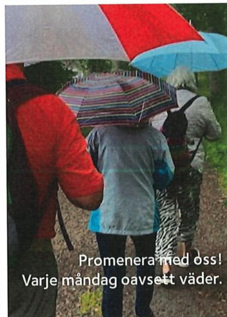
Promenera med oss! Varje måndag oavsett väder.