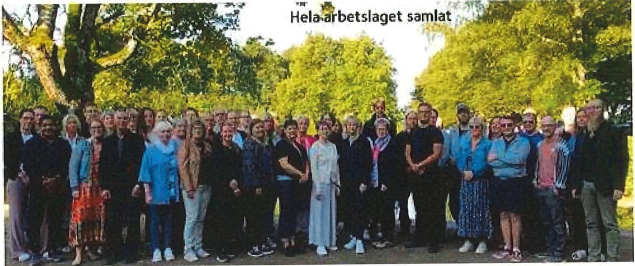
Hela arbetslaget samlat