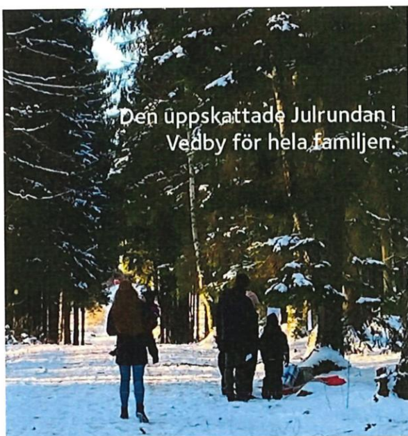
Den uppskattade Julrundan i Vedby för hela familjen.