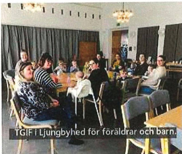
TGIF i Ljungbyhed för föräldrar och barn.