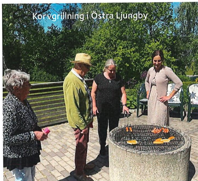
Korvgrillning i Östra Ljungby