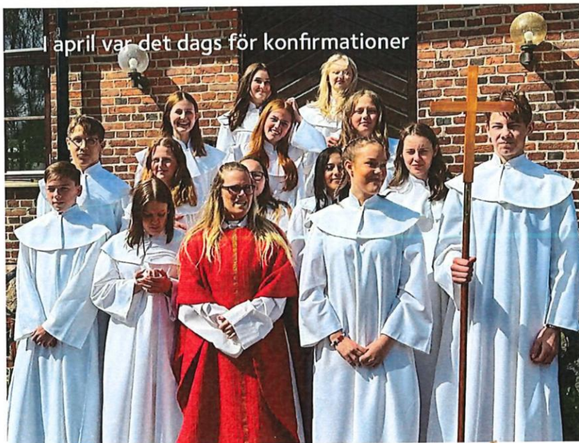
1 april var det dags för konfirmerationer