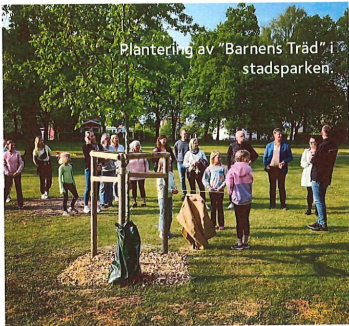
Plantering av "Barnens Träd" i stadsparken.