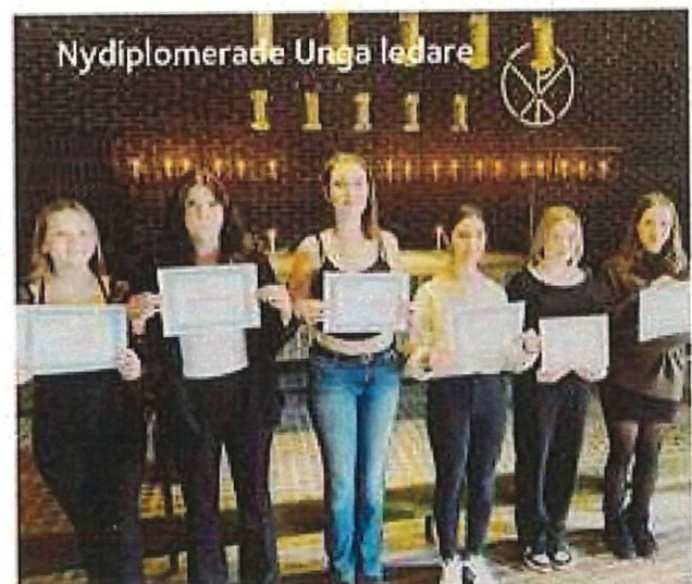
Nydiplomerade Unga ledare