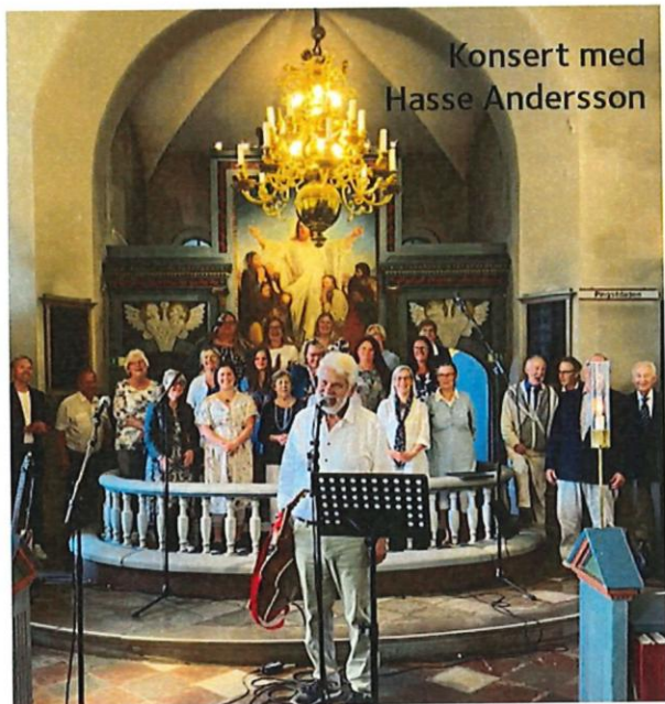
Konsert med Hasse Andersson