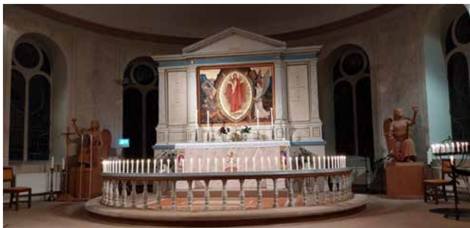
Nedan: Minnesgudstjänsten i Vankiva kyrka 5 november