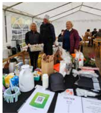
Gravsmäckningskaffe vid Norra Åkarps kyrka 3 november