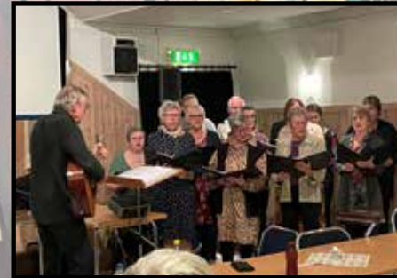
Allsångsgudstjänst 5 nov: HÅB-kören och Farstorps All Stars