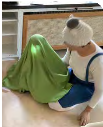
Bu och barnen upptäcker ficklampans funktion.