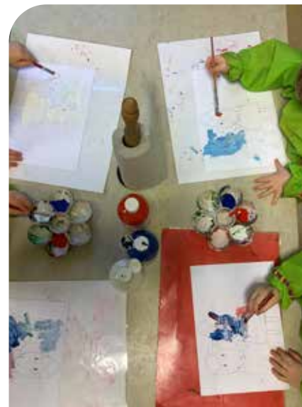
Här målar barnen Bu och Bä.