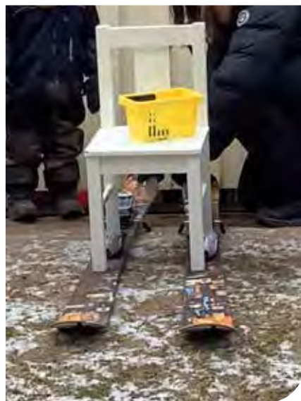
Här har vi skapat en spark.