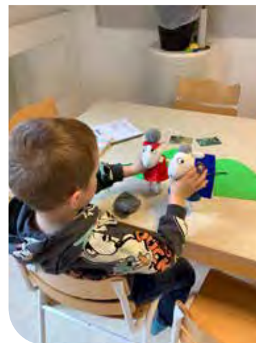
Barnen får själva återskapa berättelsen.