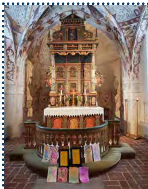
Teckningarna är gjorda av barnen i barngrupperna.