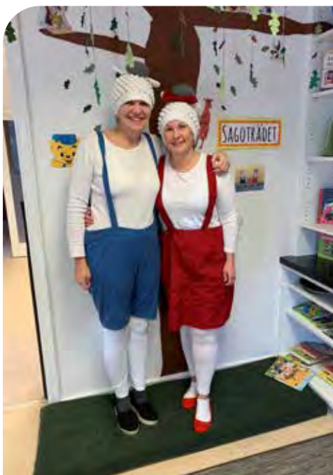
Bu och Bä på besök.