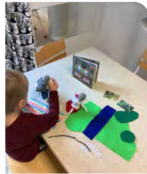
Vi berättar sagan om "Bu och Bä i skogen".