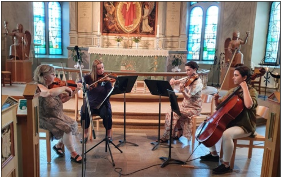
Musik av Engerkvartetten.