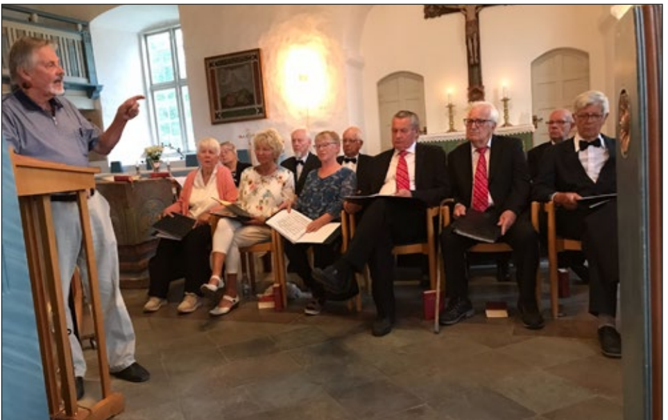
Sångare från Manskören & Verumskören