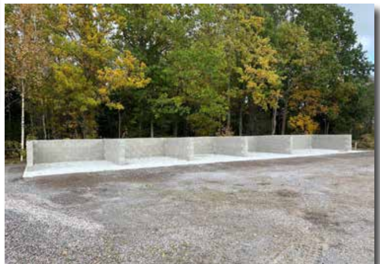
Bingar för hantering av jord, grus, kompost m.m., Kristvalla