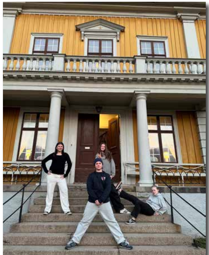
Nyfiken på? Kamraterna spenderade en kväll på Östrabo, där biskopen bor, för att få veta mer om de fyra profilyrkerna samt hur man går till väga för tjänst i kyrkan.