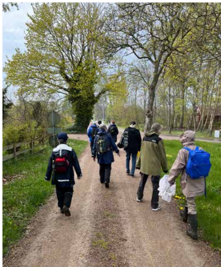
Pilgrimsvandring på Sigfridsleden 5 maj