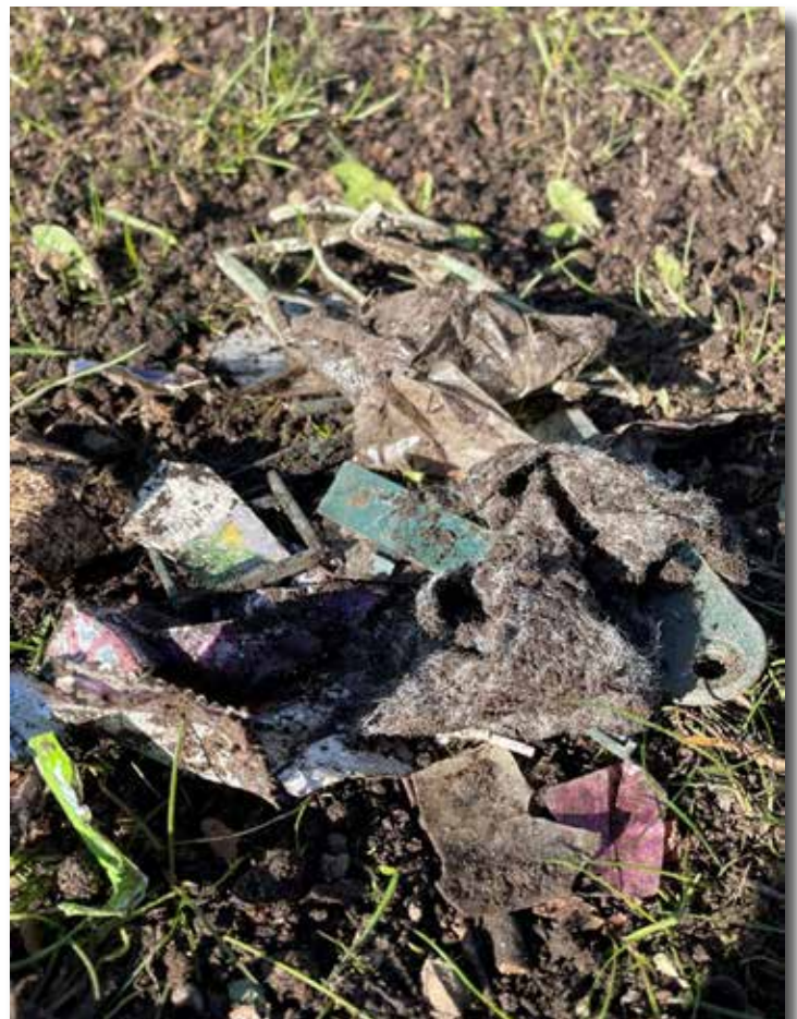
Spännande innehåll efter ihopräfsning...

Möt oss på torget under Smaka på världen Fredag den 31 maj kl. 16-18 Vi bjuder på kyrkkaffe med kakor och gemenskap!