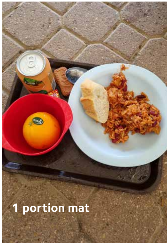
1 portion mat

De flesta har nu somnat på bussen hem. Det är natt och vi är någonstans i Tyskland. När alla vaknar upp är vi nästintill hemma men många av oss lär nog bära med känslan från Taizé ett bra tag framöver. En känsla av lugn, gemenskap och framtidstro. Veckan i Taizé har varit en fantastisk möjlighet att sätta perspektiv på vardagen, leva i stunden och tanka nytt.