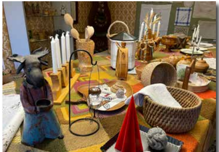
Hälleberga: Vardagshantverk från bygden.

Sammanlagt kom det 980 besökare till vägkyrkorna. Antal ideella i arbetet var nästan 100 personer (!) och det samlades in hela 11.600 kronor till Operation Smile (Hälleberga och Kråksmåla). Örsjö samlade in en god summa till Mathjälpen på Hela Människan. Bra jobbat! Tillsammans blir vi starka.