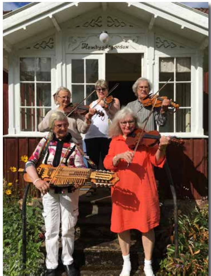
Nybro spelmanslag bidrog med härlig folkmusik vid gudstjänsten i Oskars vackra hembygdsgård i slutet av augusti.