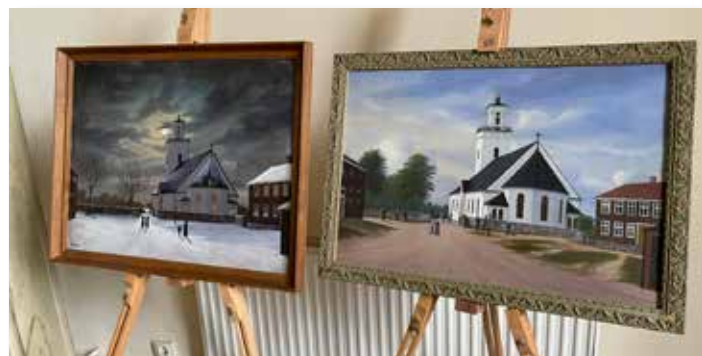
Madesjö: konstnärer från bygden.