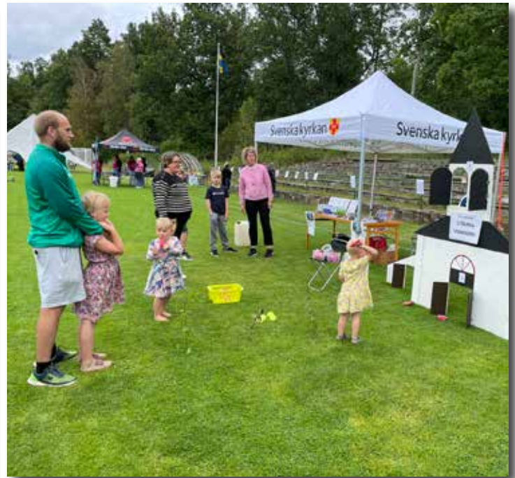
Svenska kyrkans plats vid Orreforsdagen 25 aug. Samhällets föreningar och företag samarbetade kring denna dag och visade upp sina verksamheter.