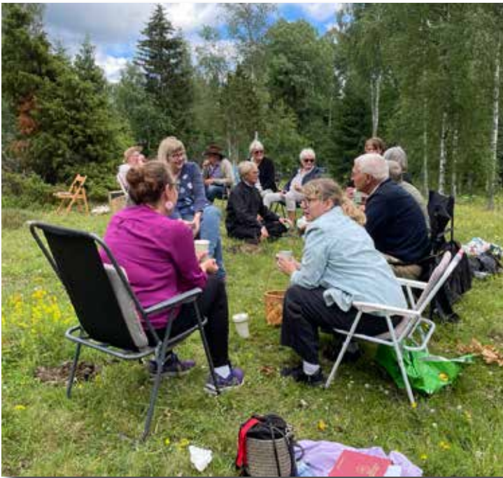
Kyrkkaffe efter friluftsgudstjänst i Duvetorps hage (Kristvalla).