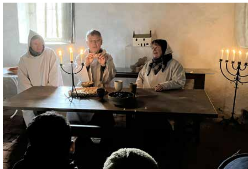
Under påskveckan genomfördes dramatiserade påskvadringar med alla barn i årskurs 3. Bild från Biskopshuset.