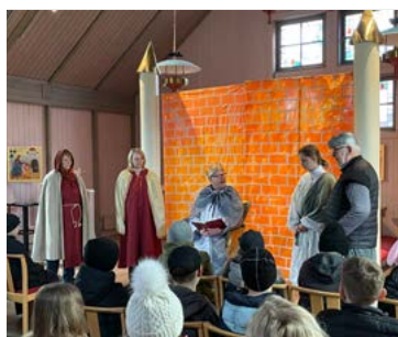
Påskvandringar har Norrahammars församling haft i ett ekumeniskt samarbete både i Hovslätt och Norrahammar för årskurs 3 och 4.