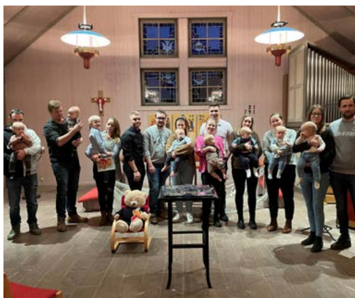
Dopfest i Kyrkvillan 15 mars. Fika med tårta, pyssel och avslutande andakt där alla fick en liten present och sin dopdroppa som hängt i dopträden sedan dopet.