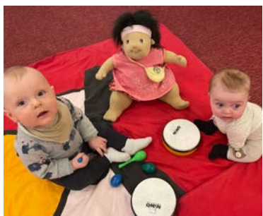
Babybrymik i Kyrkvillan.