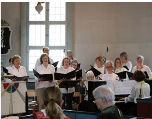
Påskkören på Påskdagen 31 mars i Norrahammars kyrka.