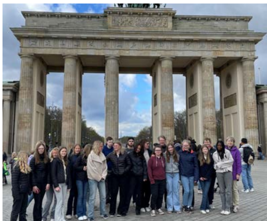
Konfirmanderna på resa till Berlin 1–4 april. Här står de utanför Brandenburger Tor.

Annandag Påsk 1 april gick resan till Berlin med konfirmander, unga ledare och anställda. Nu var det dags att åka igen efter flera års uppehåll på grund av pandemi med mera.