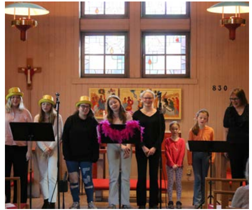
Mellogudstjänst i Kyrkvillan 14 april i Kyrkvillan.