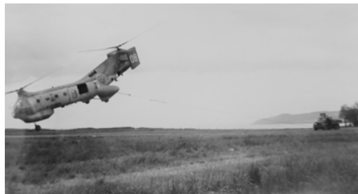
Bogserhjälp på Elmia 62.

Vi behöver historien för att förstå. Det geografiska läget har gjort Jönköping till en mötesplats. Här har det råds- och köpslagits under många, många århundranden. Men att staden skulle bli centrum för mässor och utställningar var det nog ingen som tänkte sig i början av 1900-talet.