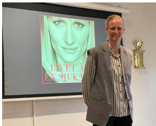
Carolina Klüft, tidigare friidrottsstjärna och OS-medaljör, 13 mars i Norrahammars församlingshem. Norrahammars församling bjöd in alla elever från årskurs 6 under dagen för att höra henne tala om "Mitt liv som sjukamp" och på kvällen föreläsning för allmänheten.