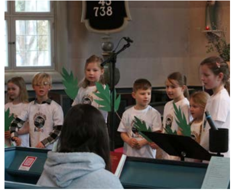
Sångbubblor på Palmsöndagen 24 mars i Norrahammars kyrka.