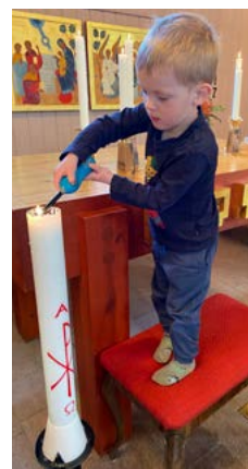
På vardagsgudstjänster i Kyrkvillan får barnen hjälpa till!