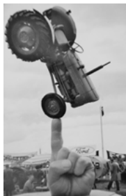
Fingertoppskänsla på Elmia 62.