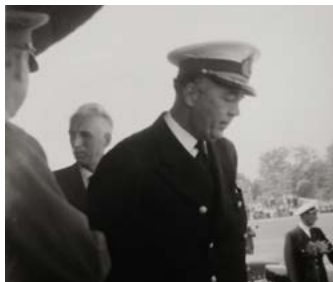
Prins Bertil. Bakom syns landshövding Allan Nordenstam. RiLa- 59.