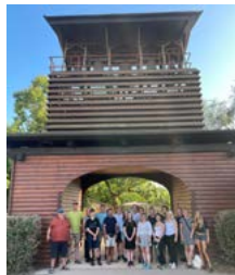
Gruppen framför klockorna i Taizé.