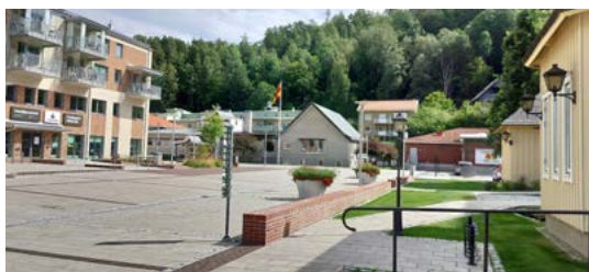
Nutid: Kyrktorget och nya kyrktrappan invigdes 27 november 2022. I mitten längst bort syns församlingshemmet.

Första församlingshemmet kom till 1954 och byggdes senare ihop med en ny byggnad. 1986 revs det gamla huset och en ny del byggdes nära Konsum (Coop). Husen norr om kyrkan revs så småningom. Marken blev parkeringsplats och liten park. Området fick helt ny funktion när Junehem i juni 2022 byggt klart husen i centrum.