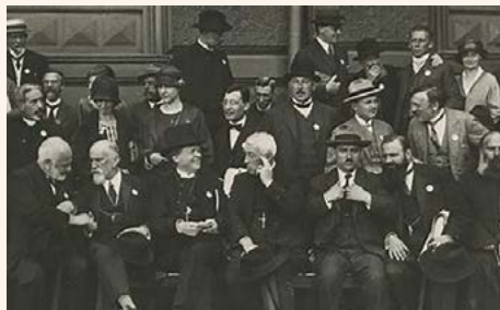
Ekumeniska mötet 1925 med ärkebiskop Nathan Söderblom

Nästa år, 2025, är ett jubileumsår för ekumeniken. Det är då 100 år sedan Svenska kyrkans dåvarande ärkebiskop Nathan Söderblom kallade samman till det ekumeniska Stockholms-mötet.