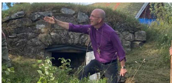
Pilgrimsvandring till kapellet vid Martinsgården som återinvigdes av biskop Fredrik 10 augusti.