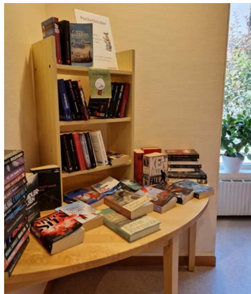
Bokhörnan i församlingshemmet i Norrahammar! Kom gärna och in och lämna böcker du läst och låna en ny!