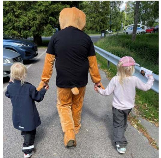
Nalle präst på väg till sångstund i Vägkyrkan.