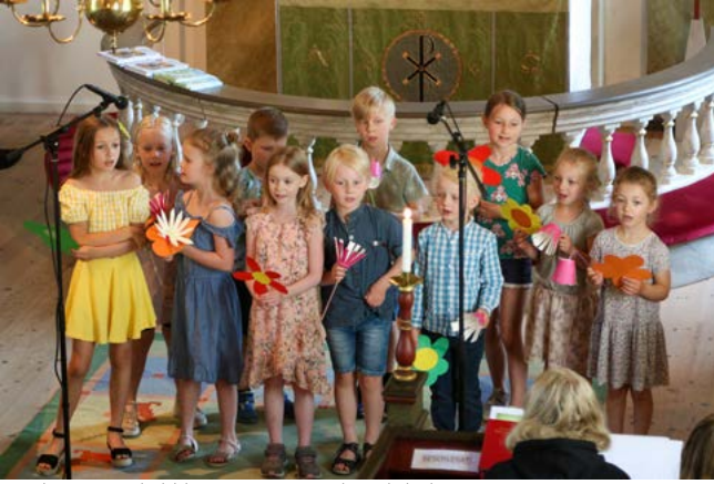
Barnkören Sångbubblorna 2 juni i Sandseryds kyrka.