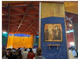
Gudstjänst med bröderna i kyrkan i Taizé.

En grupp från Norrahammar och Månsarps församlingar åkte i augusti på en resa tillsammans. Unga ledare, anställda och några andra vuxna var med på resan och vi hade en buss med två chaufförer som tryggt körde oss söderut mot Frankrike.