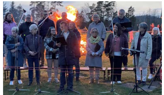
Valborgsmässokören sjunger på Hammarvallen 30 april.