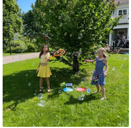
Vattenfest i Sandseryds trädgård 2 juni.