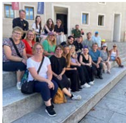
På trappan in till Slottskyrkan.