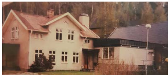
På 1950-talet blev det gula huset församlingshem och byggdes 1965 ihop med det nya församlingshemmet. Gula huset revs 1986 och istället byggdes ny del söder om entrén.

1943 blev Norrahammar köping och Norrahammar egen församling. Hela Sandseryd och delar av Barnarp ingick – och kapellet blev kyrka.