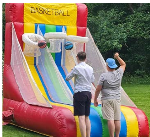
Basketboll och andra aktiviteter i Vägkyrkan 3 juli.