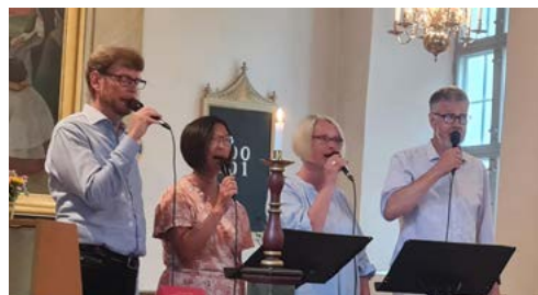
LeWe- kvartetten i Sandseryds kyrka 4 augusti.