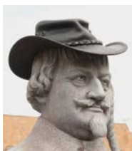
Christian IV har lånat min hatt.