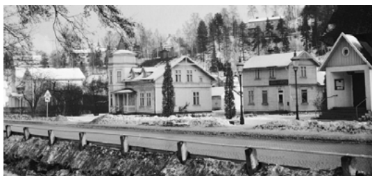
Slutet av 1960-talet: Kyrkan längst till höger, Josefssons charkuteriaffär och till vänster boningshuset.

Kyrkan invigdes 25 maj 1930, men som kapell under Barnarp. Arkitekt var Göran Pauli och hans far Georg Pauli, målade altartavlan