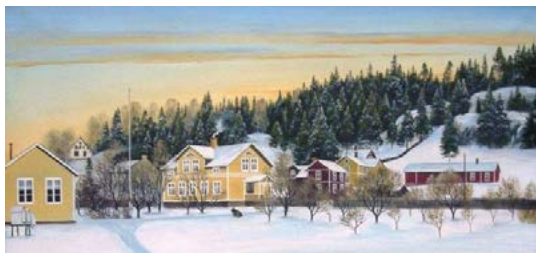
1927: Gåramålaren Ratikainen har förskönat lite, men det gula huset i mitten är det som senare blev församlingshem. Bilden på målningen är beskuren.

som föreställer Jesus i Getsemane med de sovande lärjungarna omkring sig.