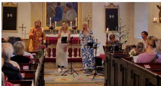
Trio Spring city i Sandseryds kyrka 30 juni.