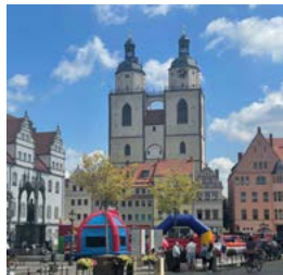
Torget i Wittenberg.