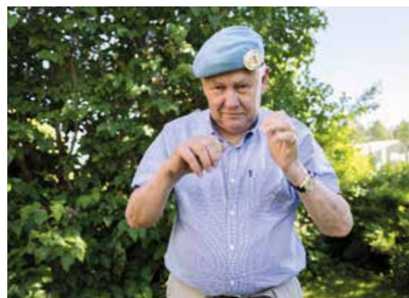
Den blå baskern bärs med stolthet och elegans.