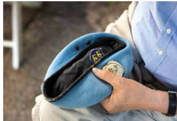
Tomas väl använda FN-basker.