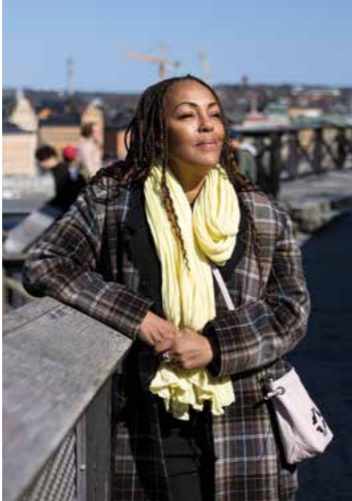
Kayo dras mer och mer till teatern.

NÄR KAYO VÄXTE UPP var det inte många svarta barn runtomkring. Det fanns en lite naiv nyfikenhet på ett annorlunda barn som ett exotiskt inslag, på det hela taget ett ganska vän-