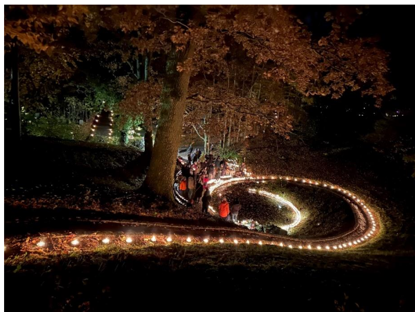
Minneslunden vid Klockarebacken under Allhelgonahelgen