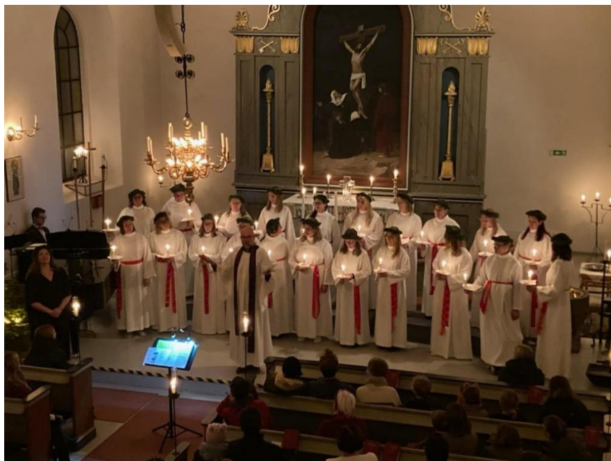
Välbesökt och uppskattad Luciagudstjänst i Tjörnarps kyrka

timme. Varje familj går i egen takt runt på de fyra stationerna. På våren inbjuds de barn som döpts föregående år och på hösten inbjuds de som inte varit på dopåtersamling två år tillbaka. Våren delades 15 änglar ut och på hösten 11. I augusti vid två tillfällen delades sammanlagt fyra biblar ut genom att barnen deltog i en skattjakt.