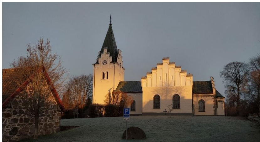
Höörs kyrka i vinterljus

Gudstjänsterna firades i stort i enlighet med gudstjänstplanen. Firandet av gudstjänster i ytterkyrkorna kan förbättras, både i antal firade gudstjänster och i antal deltagare. Under året 2023 valde vi att förlägga Luciagudstjänsten i Tjörnarps kyrka, för att stärka ytterkyrkorna, vilket föll väl ut som man kan se i statistiken över mest välbesökta gudstjänster under året. Kyrkkaffe och i synnerhet församlingsluncherna har varit mycket uppskattade.