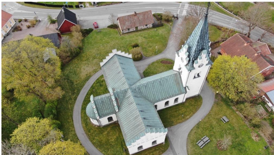
Höörs kyrka från ovan

Att bidra till att anhöriga kan mötas på gott sätt efter begravning samt att genom att hyra ut våra lokaler bidra till goda möten för andra organisationer, församlingar och till stiftet.