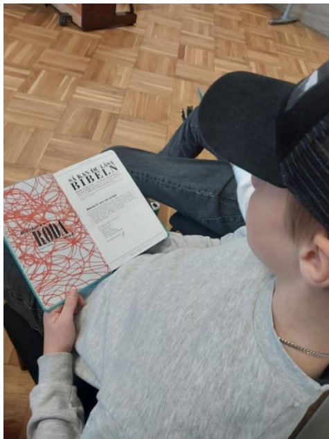
Bibelläsning och bibeltolkning på konfirmandträff

Ungledare: Fyra träffar i Höörs församlingshem och ett lägerdygn. Träffar med ämnen som gruppdynamik, ledarrollen, andaktsmetodik, lekmetodik, första hjälpen, kompis själavård mm