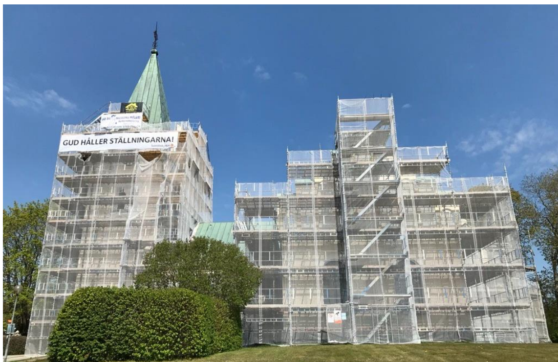
Omtalad och uppskattad banner vid renoveringen av Höörs kyrkas fasad

Genom utvärdering när respektive evenemang är över.