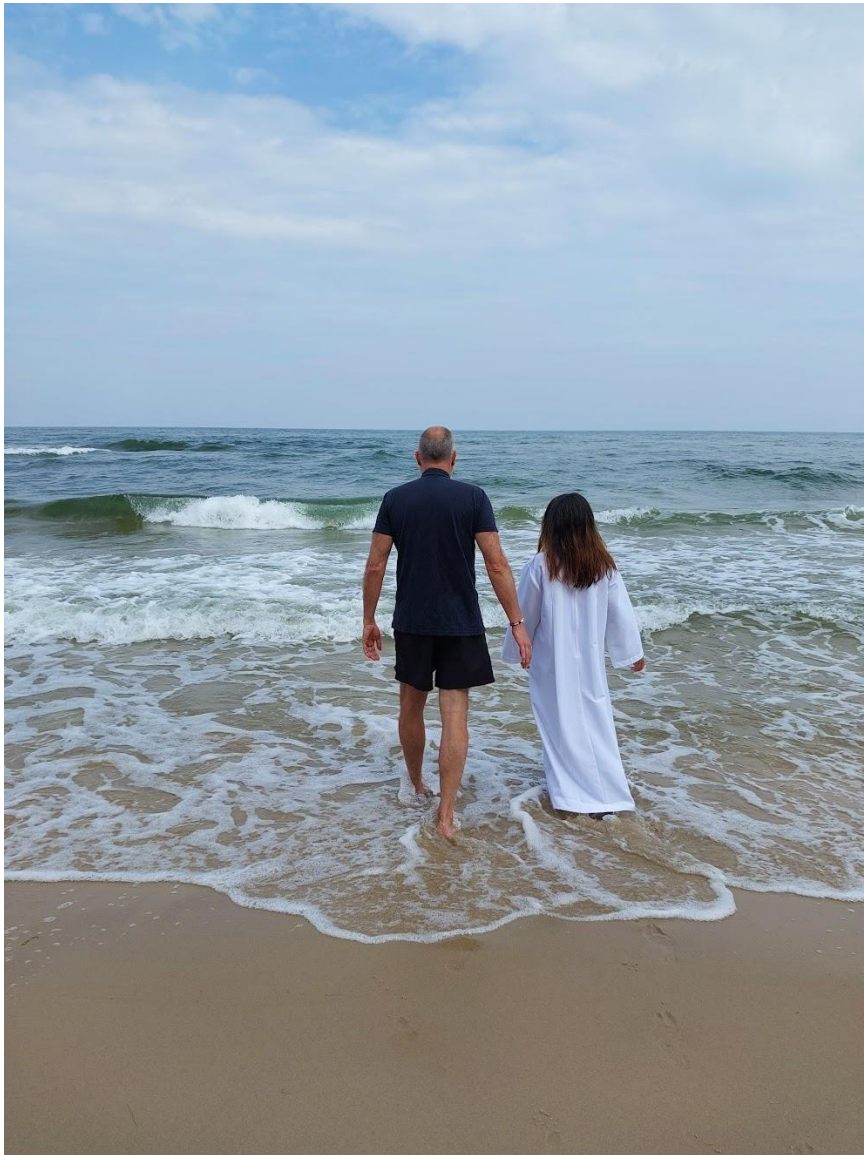
Konfirmanddop i havet sommaren 2023