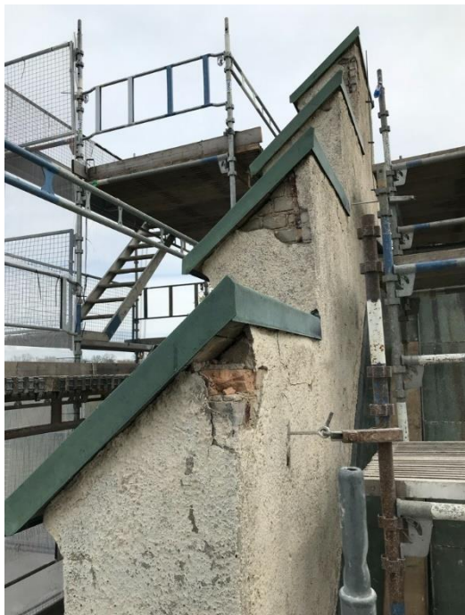
Bild från före renoveringen av fasad och tak på Höörs kyrka