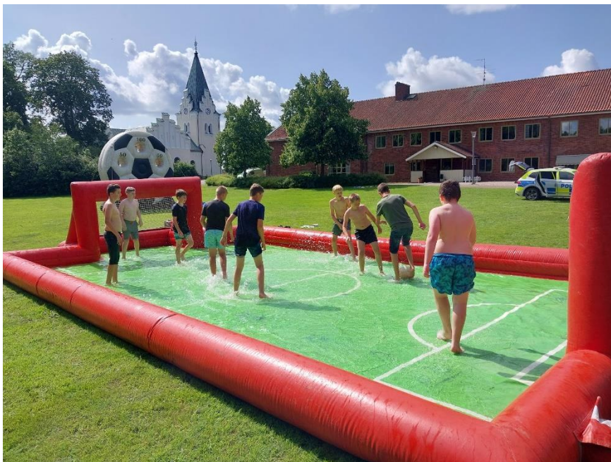
Bild från åk7dagarna som församlingen anordnade i samarbete med skolor och polisen