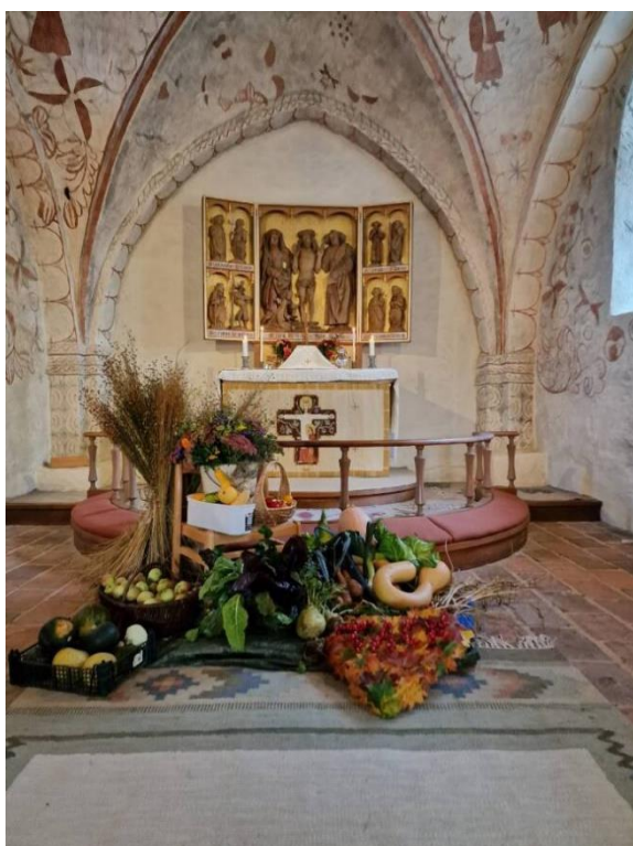
Hallaröds kyrka smyckad inför Tacksägelsegudstjänst

Olika former av pilgrimsvandringar ska erbjudas, både längre och kortare. Utveckla arbetet kring ideellt engagemang kring församlingens pilgrimsvandringar. Pilgrimsvandringarna planeras av pilgrimsgruppen som består av ideella samt en anställd som samordnare. Arbeta med GPS-kordinater och upplägg av vandring mellan församlingens kyrkor. Utökad samverkan med Stiftet och pilgrimsansvarig. Samarbeta med Ringsjö församling i samband med vandringen i jultid.