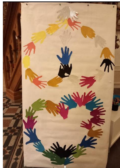
Skapande i musik i färg på barnkördagen och gudstjänsten Barn av Gud