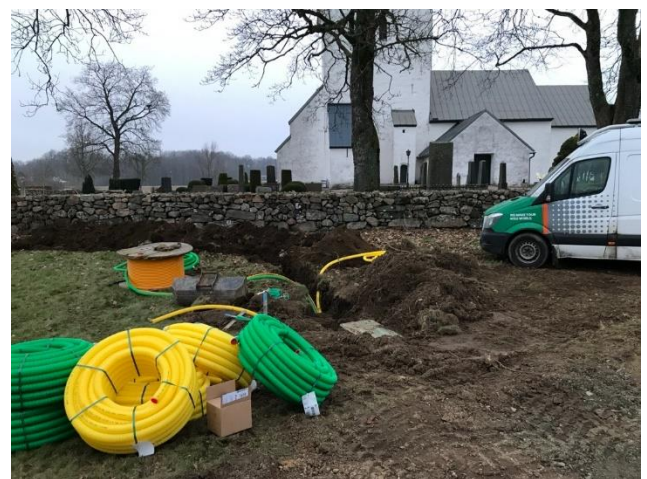
Till vänster: Höörs kyrka med ny belysning. Till höger: Fiber till Hallaröds kyrka