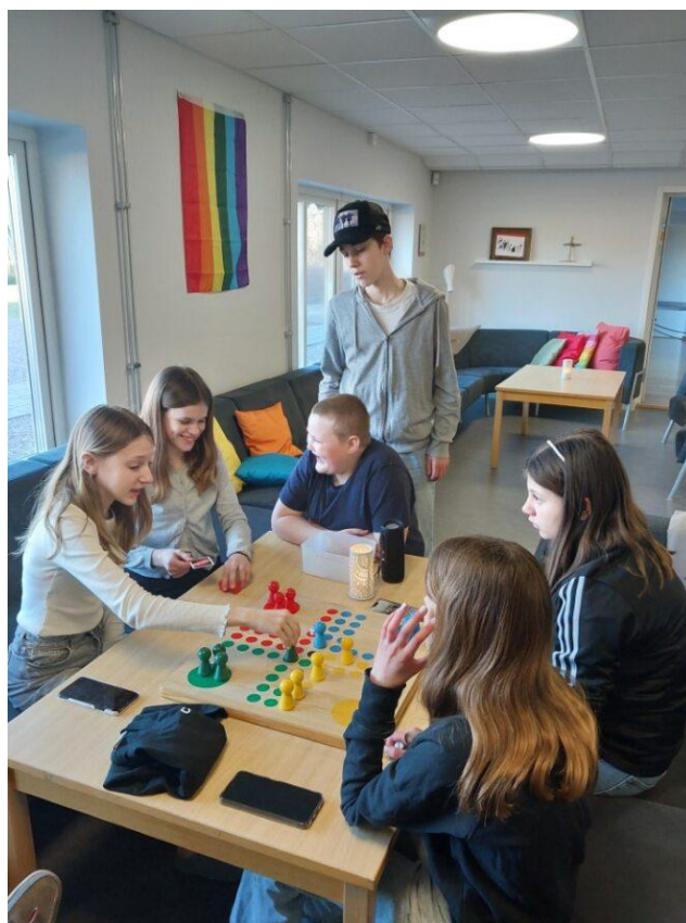
Konfirmanderna spelar spel

Målet för resan till Polen: Bidra till kunskap och lärande kring förintelsen, motverka och sprida kunskap om antisemitism, möjlighet till reflektion över sina val och ställningstagande.