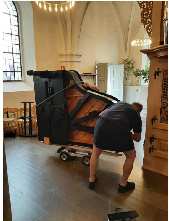
Flygeln i Höörs kyrka på väg till restaurering

Fastighetsförvaltare rapporterar kontinuerligt under året till församlingens byggnadsutskott, för att säkerställa att planerade åtgärder utförs. Likaså anlitas extern antikvarie, för upprättande av intyg och rapporter, vid de tillfälle som Länsstyrelsen kräver detta.