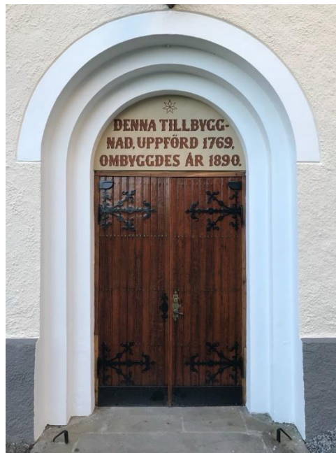
Före och efter renovering av kyrkport