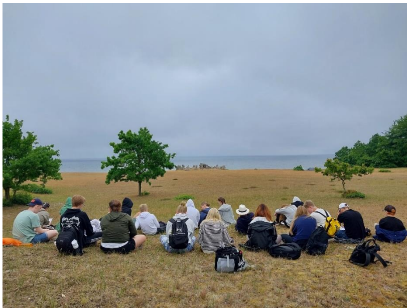
Sommarkonfirmanderna pausar under sin vandring vid Haväng.

I slutet av året drabbades hela Svenska kyrkan för en cyberattack, så kallad ransomware, som innebar att datorer och system slogs ut helt eller delvis. Denna påfrestning innebar extraarbete och stress för personalen samt att ekonomiredovisning, hemsida och statistik bland annat inte kunde uppdateras eller utföras som normalt. Trots attacken kunde församlingen genomföra sin planerade verksamhet, både inom församlingens grundläggande uppgift och inom begravningsverksamheten.