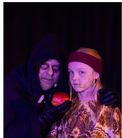
Åklagaren och barnet