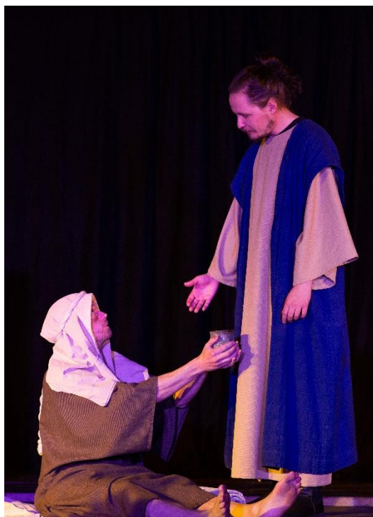
Jesus och den lame mannen