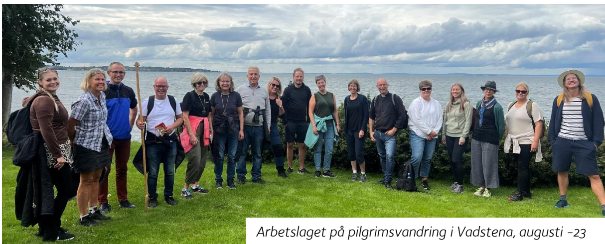
Arbetslaget på pilgrimsvandring i Vadstena, augusti -23

Barnomsorgen har under året fått en mer stabil bemanning och har kunnat fokuserat på sina konkreta mål. Förskolan har jobbat med matematik, språk och träning av grovmotoriken. Fritidshemmet har arbetat med olika miljöfrågor, ökat barnens matematiska kunskaper och teknologi.