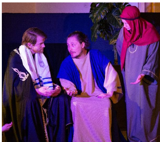
Jesus i samtal med Nikodemus