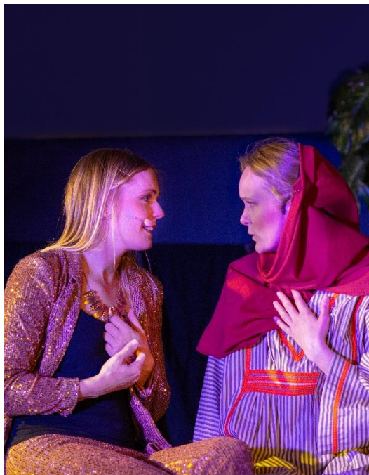
Wilma och den samariska kvinnan