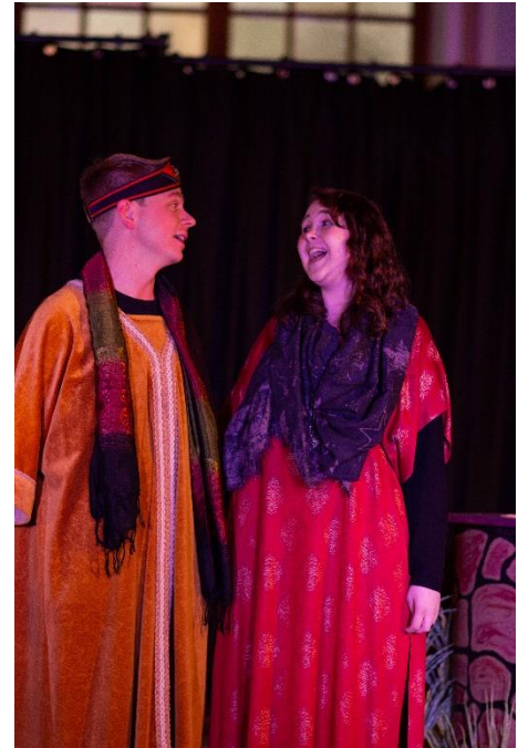
Par som besjunger kärleken