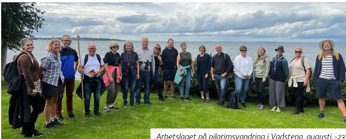
Arbetslaget på pilgrimsvandring i Vadstena, augusti -23

Barnomsorgen har under året fått en mer stabil bemanning och har kunnat fokuserat på sina konkreta mål. Förskolan har jobbat med matematik, språk och träning av grovmotoriken. Fritidshemmet har arbetat med olika miljöfrågor, ökat barnens matematiska kunskaper och teknologi.