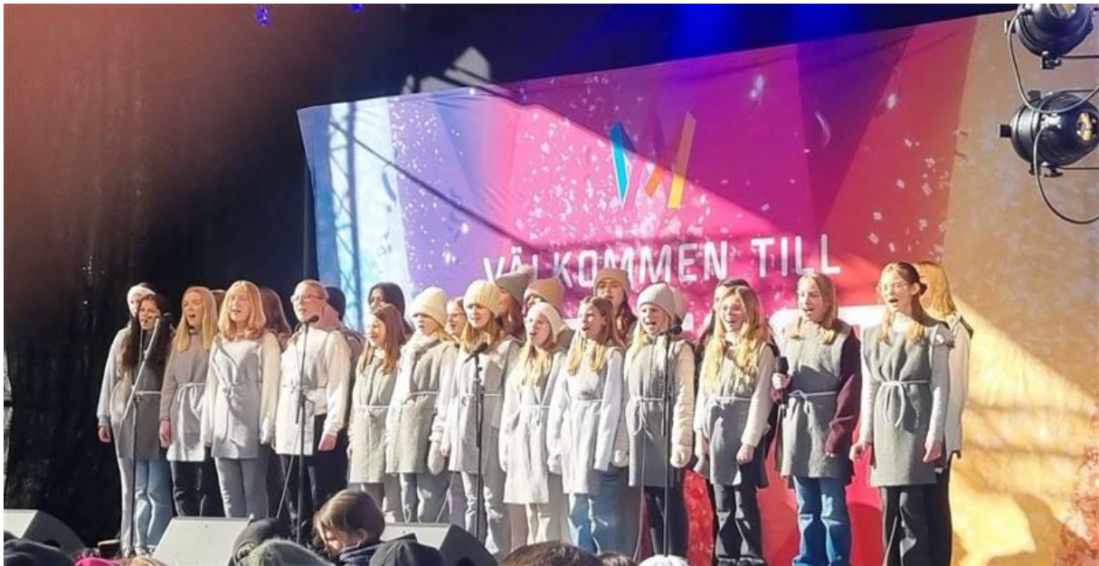
Nova sjöng i Rådhusparken.

Att Melloturnén landade i Jönköping i lördags har väl inte undgått någon. Innan själva tävlingen på Elmia var det Mellofest i Rådhusparken. På plats i den välbesökta parken fanns bland annat Sofiakyrkans barnkör Nova och sjöng sången Drömljus.