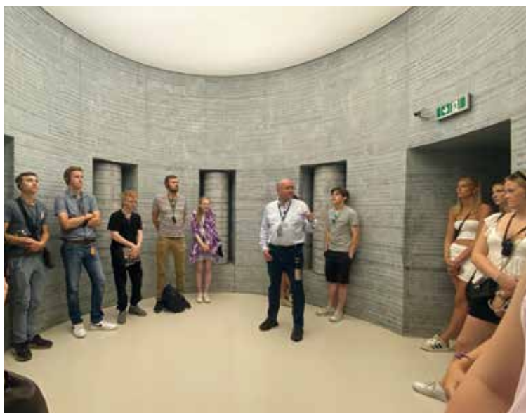
Studieresa till Krakow med besök på Schindlers fabrik.

Det är svårt att vara modig, att stå upp för rätten och friheten, att orka vara solidarisk med hela mänskligheten. Det är också svårt att möta döden. Att behöva säga adjö till nära och kära eller att bearbeta sin egen dödlighet när kroppen orkar allt mindre. Men samtidigt ser vi också det vackra. Godheten och kärleken som drabbar oss, vi ser skönheten i skapelsen, människorna som hjälper