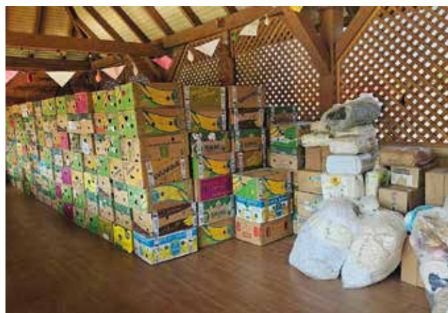
En transport från Vallby Equmeniakyrka har just anlänt till Ukraina. September 2024.

Alla samfund och kyrkor i Karlskrona har ett gemensamt nummer, Ukraina-Hjälpen 123 138 1961, dit du kan