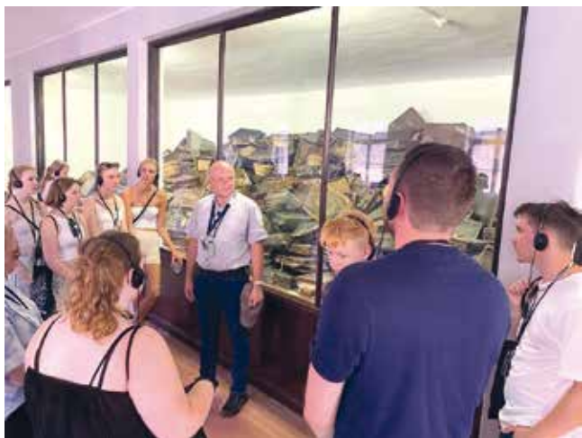
Ett jobbigt men intressant besök i Auschwitz-Birkenau.

kenau där vi bland annat fick se porten där tågen rullade in och baracker där judar både sov och gjort sina behov. Det var en obehaglig upplevelse men väldigt lärorikt och nyttigt för framtiden. Efter vandringen genom lägret var det dags för lunch. Det serverades schnitzel med potatismos med hallon