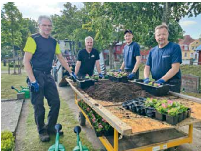
Kyrkogårdsvaktmästarna sköter bland annat plantering och vattning av 300 skötselgravar.

Östra delen av kyrkogården rymmer också Minneslunden och Askgravlunden, två platser för att hedra och minnas de avlidna på olika sätt. I Minneslunden sänks askan ned i jorden på en anonym plats, medan en vacker fontän och en särskild plats för blommor ger de sörjande möjlighet att minnas sina nära och kära. Askgravlunden erbjuder en mer personlig lösning, där den avlidnes namn, ålder och ett identifikationsnummer grave-ras på en bricka som fästs på en stempelare. Detta nummer motsvarar en markering i gräsmattan som visar var