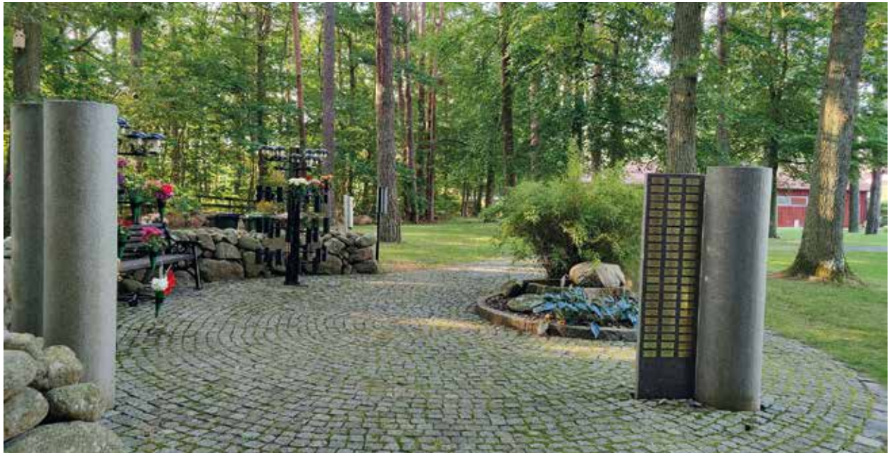
Askgravlunden är en rofylld plats på kyrkogårdens östra del.