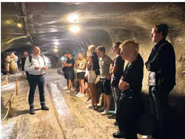
Besök i Saltgruvan i Wieliczka utanför Krakow.

Dagen efter, den 25/8 var det dags att besöka Auschwitz-Birkenau. Detta skulle visa sig vara både jobbigt mentalt för en del men också väldigt intressant då man fick höra och se mer om historien. Först besökte vi Auschwitz. En av de första sakerna vi såg var skylten "Arbeit macht frei". Många är de fångar som sett denna skylt och gått mot sitt slut. Detta satte en stämpel på hur resten av besöket skulle bli. Efter det fick vi se flera rum fyllda med bland annat skor, barnkläder och ägodelar. Vi fick även besöka gaskammare och rum där judarna hade sovit. Vi fortsatte besöket i Bir-