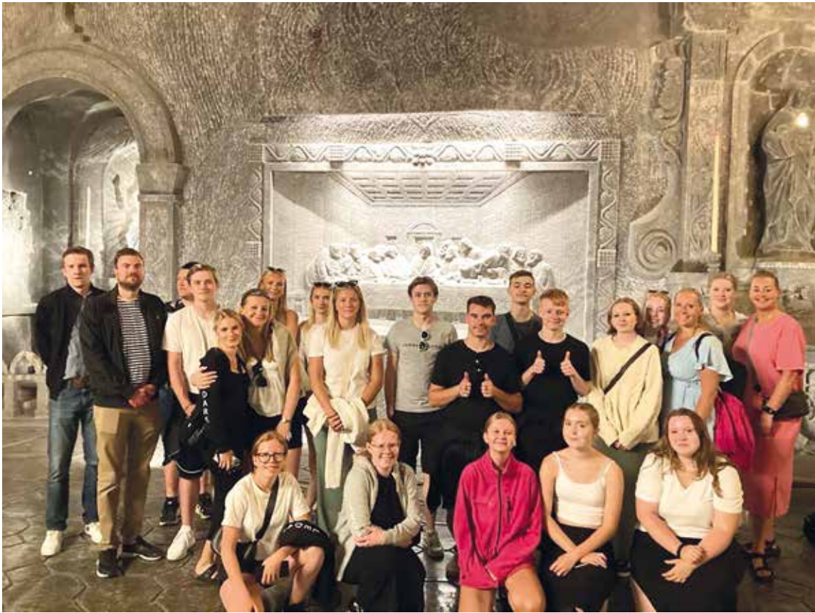
Unga ledare från Rödeby och Sölvesborgs församlingar på studieresa i Polen.