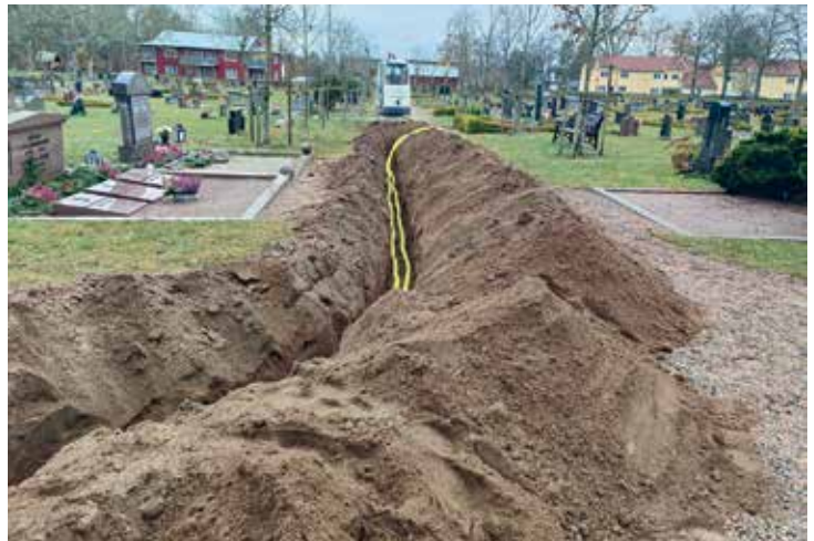
Vaktmästarna gräver ned kabel till laddpunkten på kyrkogårdens parkering.