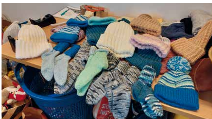
Tack till alla er som skänker gam och som stickar värmande sockor, mössor och vantar till människor på flykt.