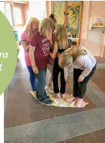
Samarbetsövning där barnen fick hjälpa varandra att vända mattan utan att kliva av och nudda golvet.