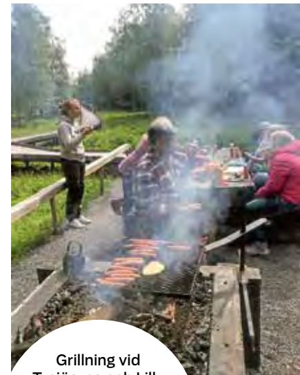
Grillning vid Tysjöarna och Lillsjön; vi har spenderat tid ute i naturen för att lära oss om fåglar, leka laglekar och njuta av krabelurer och korv.