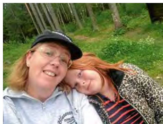
Nöjda ledare = nöjda barn.

TEXT & FOTO: KATARINA MONTONEN CHRISTINA MÄKELÄ