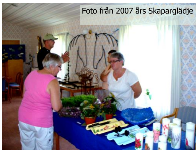
Foto från 2007 års Skaparglädje