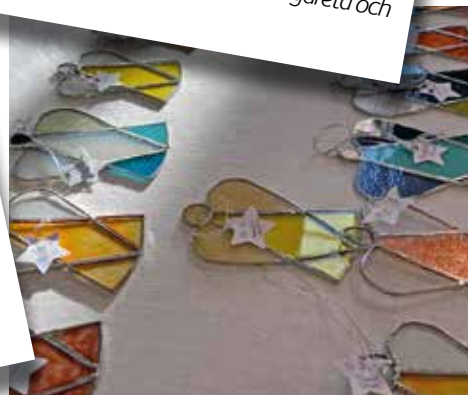
Hurra! Februari inleddes med "dopfest" och 2021 års döpta fick ta emot sina glasänglar. Vid borden kladdades det både med tårtor och kitor - härligt!