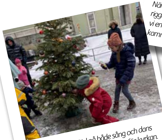
Stora som små bjöd på både sång och dans under årets julgransplundring utanför kyrkan.

Tack vare dig är Svenska kyrkan i Norge en självklar plats för många svenskar, både för liten och stor. De senaste åren har inte varit som vanligt men här är några tillfällen som vi kunnat mötas.