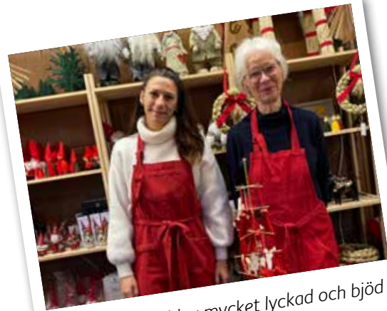
Basaren 2021 blev mycket lyckad och bjöd på flera nya som gamla möten.