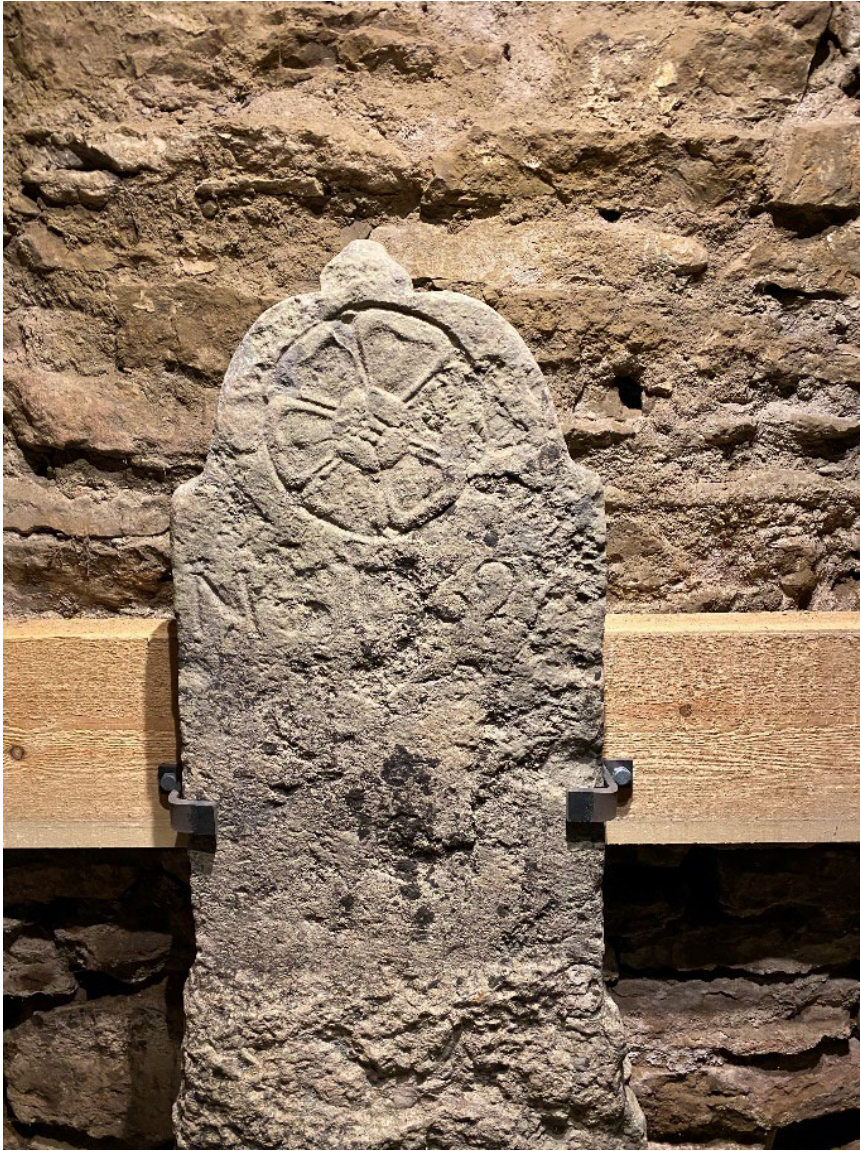
"Skillnadsgravsten" av kalksten från 1690-talet med inhuggen ros. MS(D) 169(?)