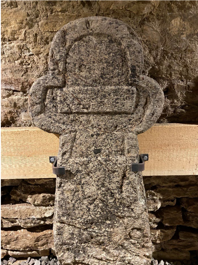
Klöverformad kalkstensvård från 1600- eller 1700-talet.