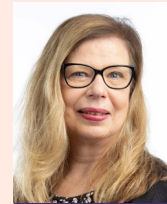
Susanne Ek Samverkan & digitalisering Nationell nivå