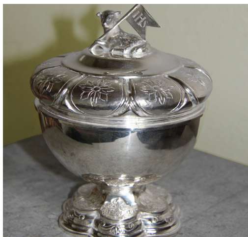
Den välputsade oblatasken finns så klart med i inventarieförteckningen.

Inventarieförteckningen är ett sätt att stärka den lokala historien för framtiden. Den är också en källa för forskning.