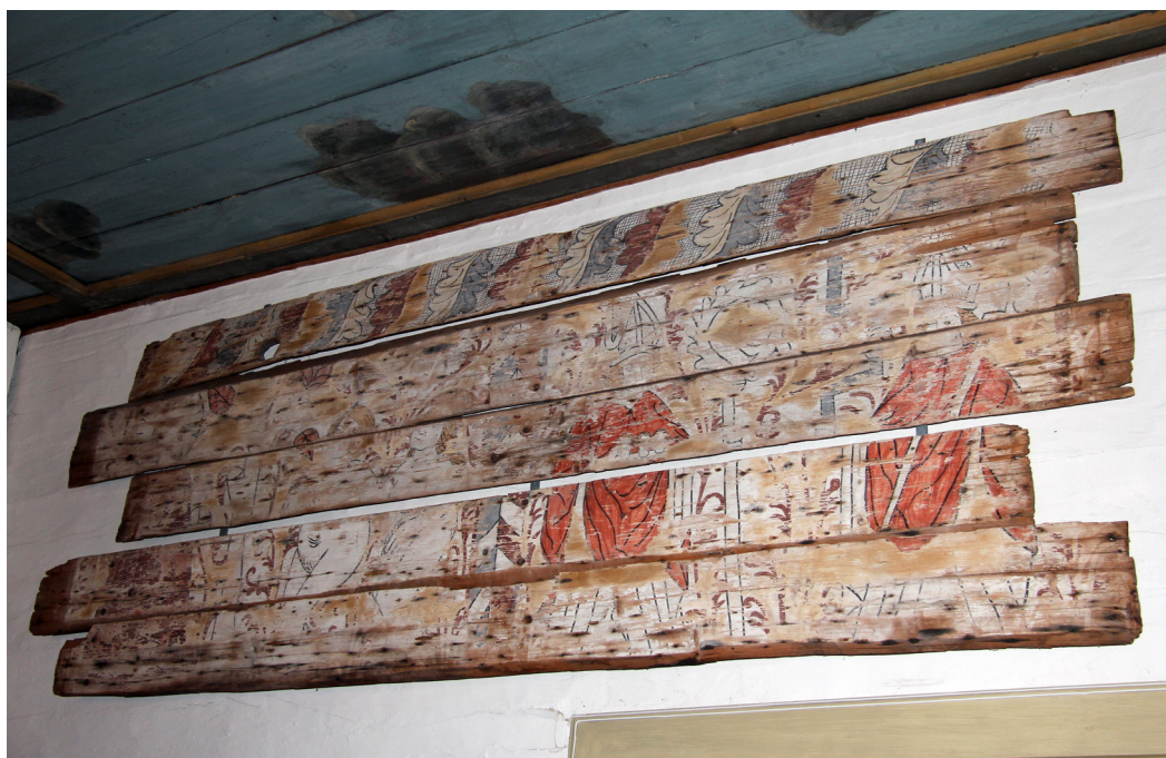
Fast inredning eller byggnadsdelar som demonterats räknas som lösa inventarier.