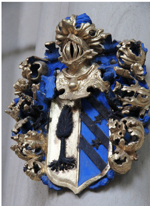
Släktvapen, så kallade huvudbanér, finns i många kyrkor.