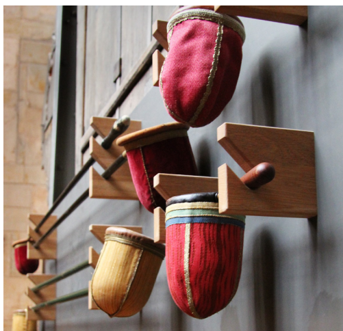
Den skonsammaste förvaringen för kollektåvar är att låta dem hänga horisontellt.