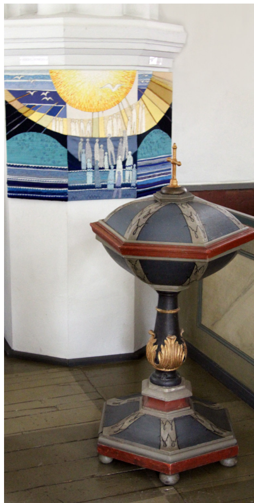
Det finns inventarier från olika århundraden att ta hänsyn till. Textil från 1900-talet och dopfunt från 1700-talet samsas i Björsätters kyrka.

Uppgifterna i den gamla förteckningen ska föras över i sin helhet till den nya. Detta är mycket viktigt för att få kopplingen mellan de olika förteckningarna.