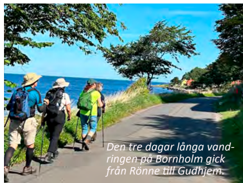
Den tre dagar långa vandringsleden på Bornholm gick från Rønne till Gudhjem.