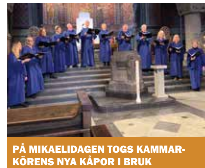
PÅ MIKAELIDAGEN TOGS KAMMAREKÖRENS NYA KÅPOR I BRUK

Den 30 oktober lägger Antje Jackelén ner ärkebiskopstaven vid en gudstjänst i Uppsala domkyrka. Den 4 december mottas Martin Modéus som ny ärkebiskop vid en annan gudstjänst i Uppsala domkyrka. Martin Modéus är sedan tidigare biskop i Linköpings stift.