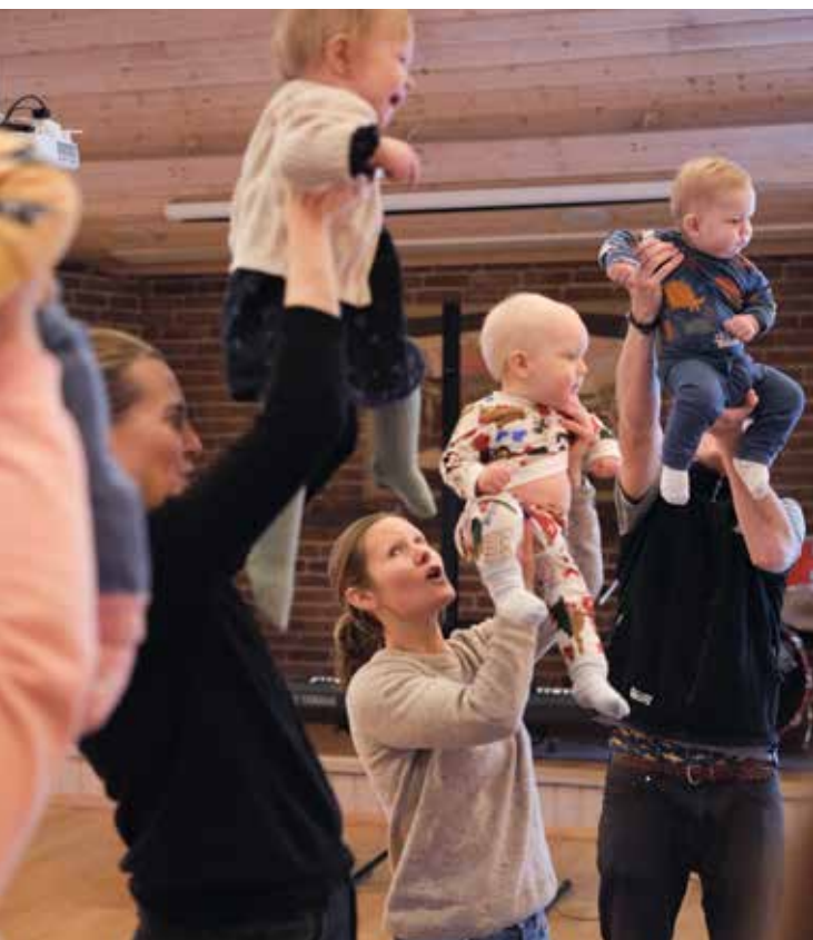
Dans med bebisarna.

– Det är fint att kunna hitta på saker med Nike och babycafé är en rolig aktivitet, säger hon.