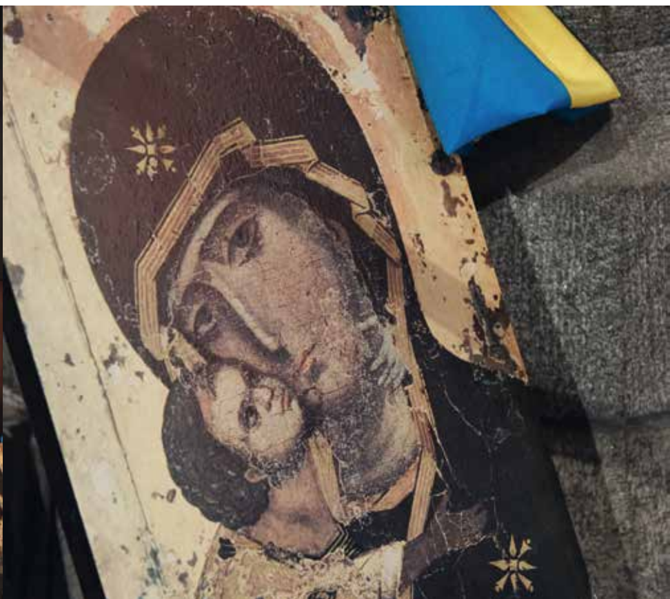
Framme vid ljusgloben står numera en ikon vid namn Kärleksfull ömhet. Den föreställer moder Maria och Jesusbarnet.

DEI 11. Under 2022 uppmärksammar Saltaren Uppenbarelse- kyrkan. Det kan vara konsten, interiören, en plats, en detalj som får stå i fokus.