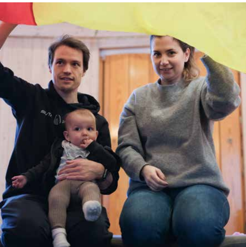
Nike gillar tyget.