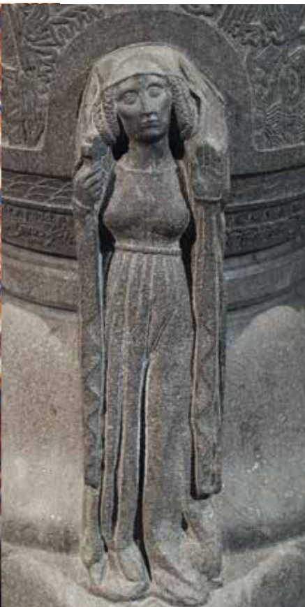
S:ta Margareta, barnmorskornas förebild.