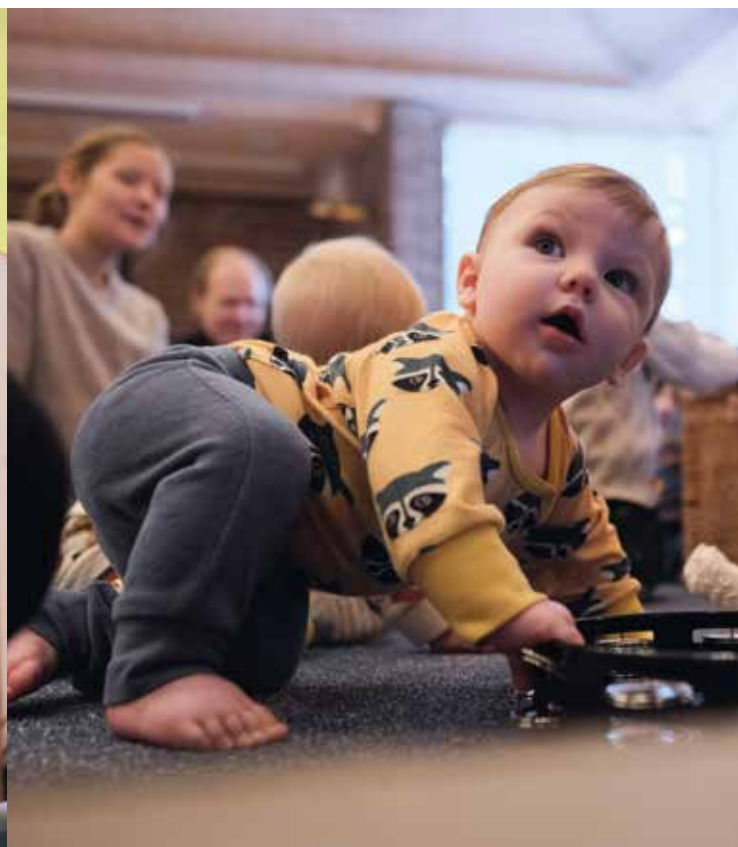
Maracas-lådan är populär.

Det är drag i sångstunden på kyrkans babycafé i Saltsjöbadens församlingshem. Varierad musik, olika instrument, sånger i olika tempo och rörelser gör att både föräldrar och bebisar rycks med i sångstunden.