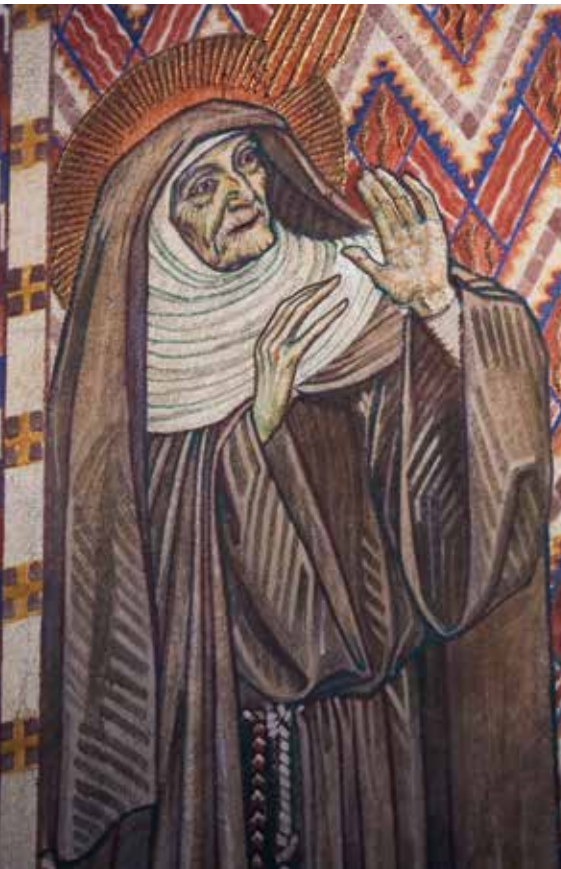
Den heliga Birgitta.