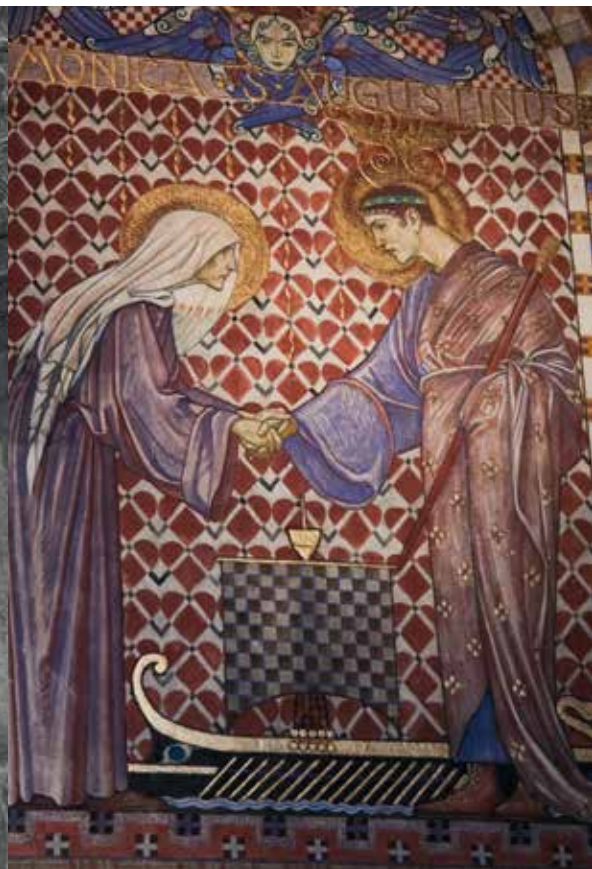
Monica, Augustinus moder.

uttryckssättet. Här kan vi i stället se Platon och Sokrates uppenbaras, säger Lars.