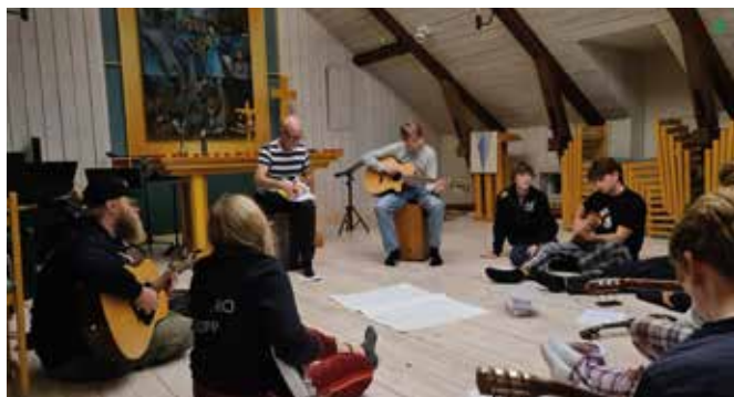
Full fart i musikverkstan.