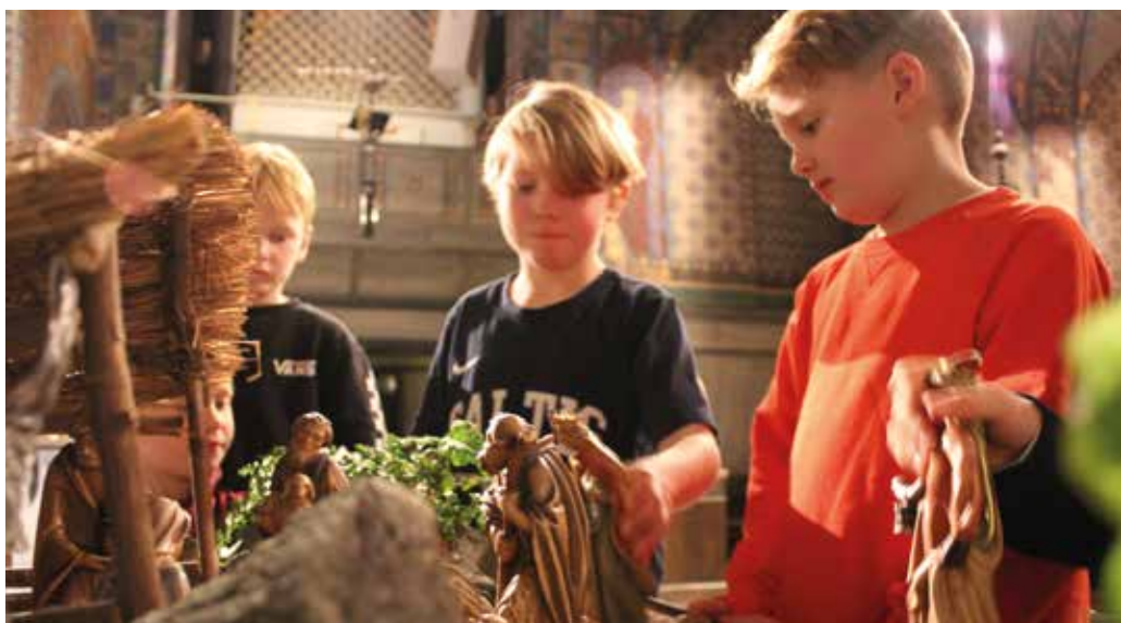
Alla barn får hålla i varsin figur under krubbvisningen.