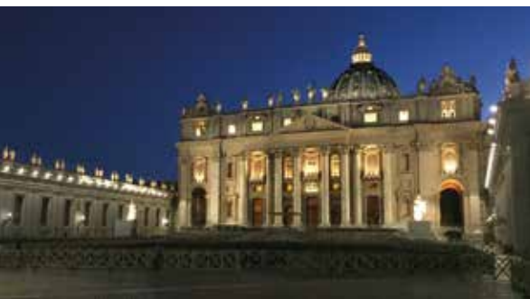
En uppskattad jultradition i SVT är midnattsmässan från Rom.

– På den tiden när julottan direktsändes hade vi genrep klockan 05.00. Sen var det snabbt vidare till nästa sändning på annandagen. Idag har jag tid att vara med min familj under julen och njuter av det, säger han.