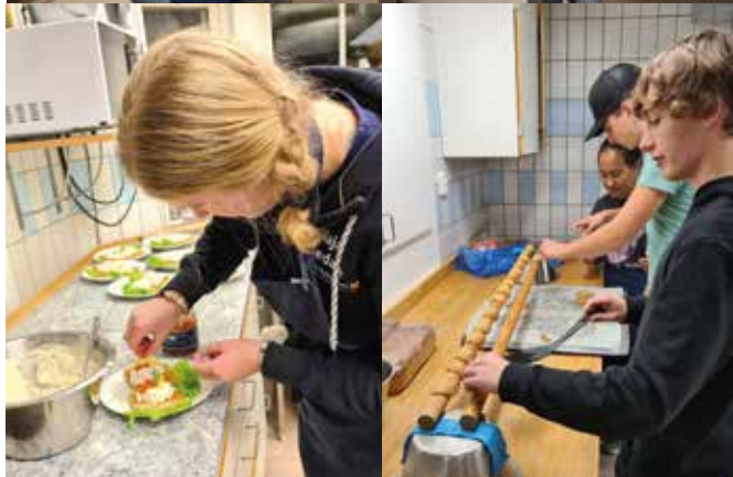
Glädje och koncentration under matlagningen.