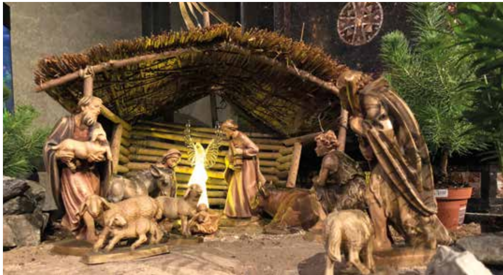
Den första julkrubban skapades av Franciskus av Assisi år 1223.