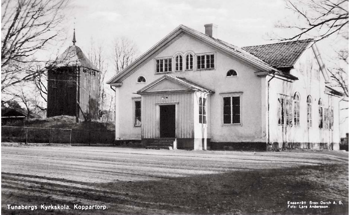
Tunabergs Kyrkskola, Koppartorp.