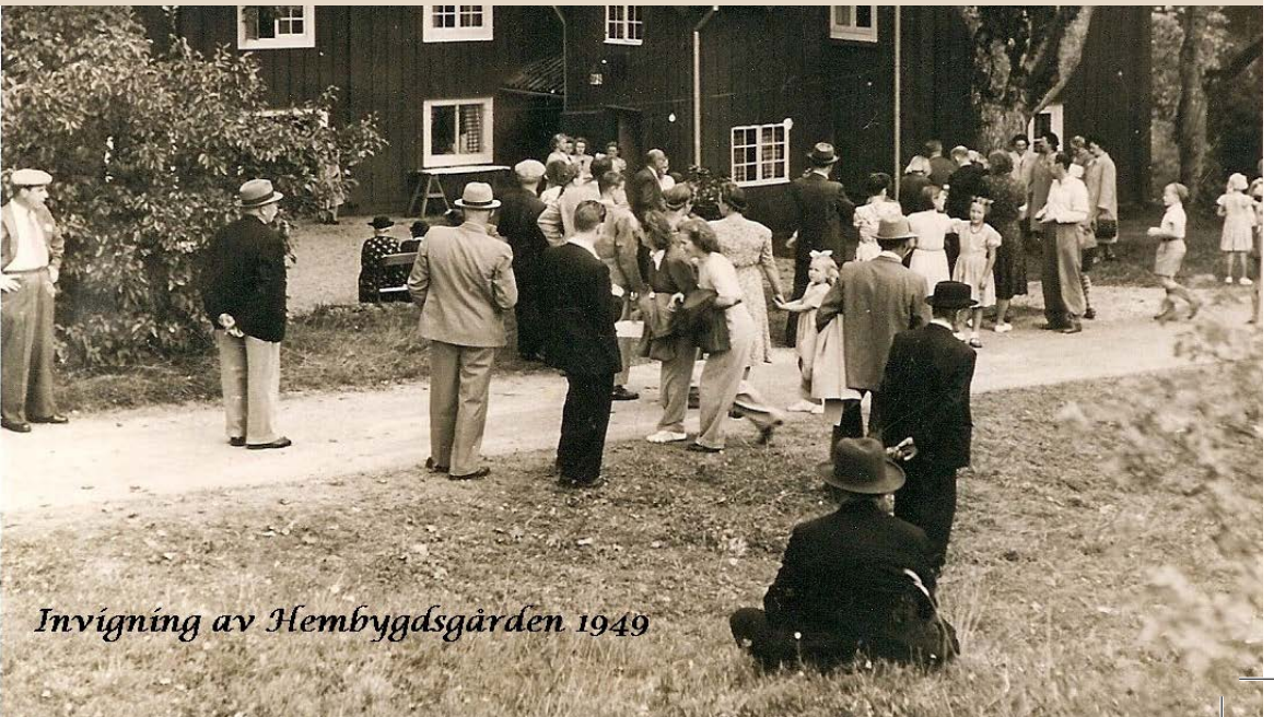
Inviqning av Hembygdsgården 1949