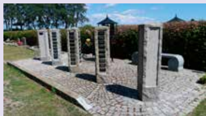
Askgravlunden har utökad

Kistgravlund: Finns på Mjällby kyrkogård. Här gravsätts kistan med den avlidne på en markerad plats. Här används namnplatta som bekostas av dödsboet.