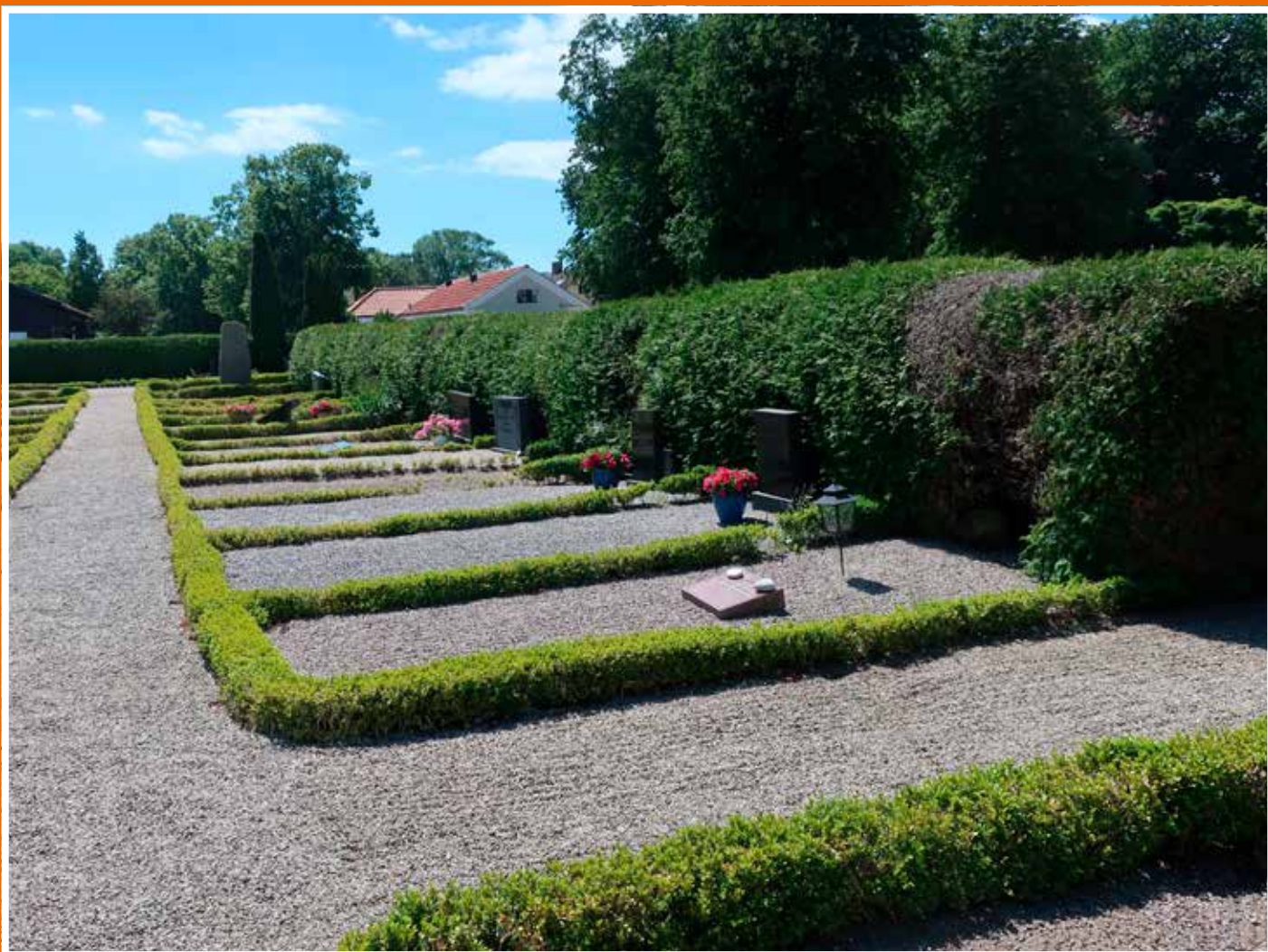
Vy över Mjällby kyrkogård.