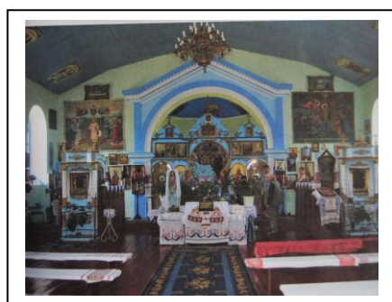
Den ortodoxa kyrkan i Zmijivka (Gammalsvenskby)

På två timmar en måndagseftermiddag hade en stor del av byn dykt upp och jag och en kollega firade mässa enligt gammalsvensk ordning. Det var en stor upplevelse. Kyrkan i Gammalsvenskby delas mellan den svenska församlingen och den Ukrainsk-ortodoxa Kyrkan och det råder gott ekumeniskt samarbete här. Jag fick även träffa den ukrainske prästen, som kunde en del svenska.