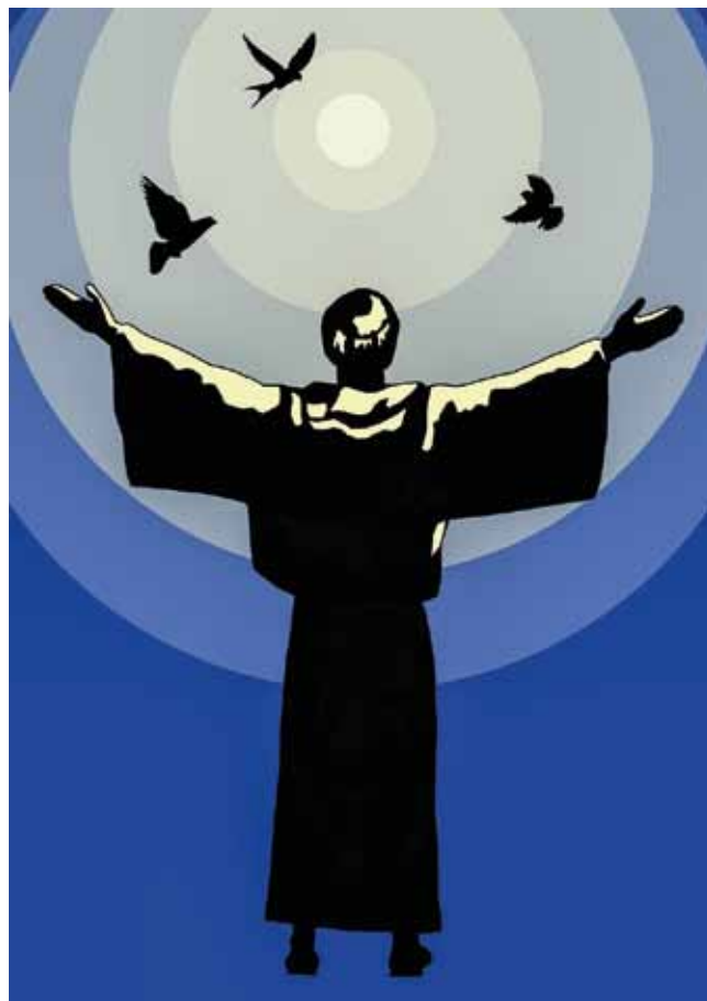
Franciskus skapat av Sebastiano Iervolino, Pixabay