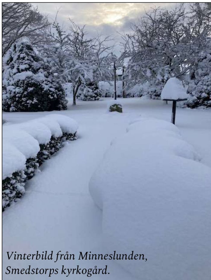
Vinterbild från Minneslunden, Smedstorps kyrkogård.

Vi skottar endast gångar fram till kyrkporten, Askgravplatsen och Minneslunden samt vid gudstjänster och förrättningar.