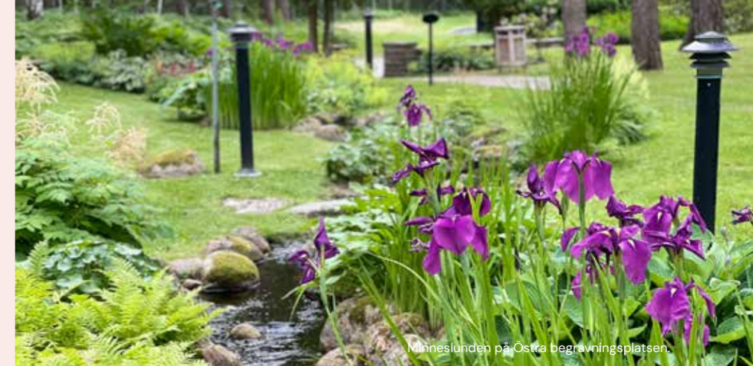
Minneslundan på Östra begravningsplatsen.