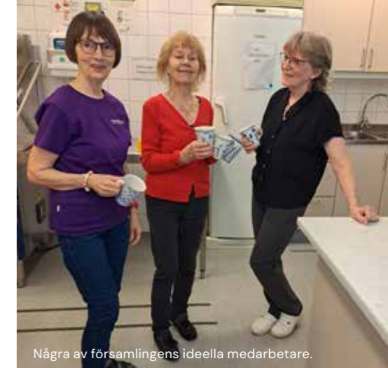
Några av församlingens ideella medarbetare.