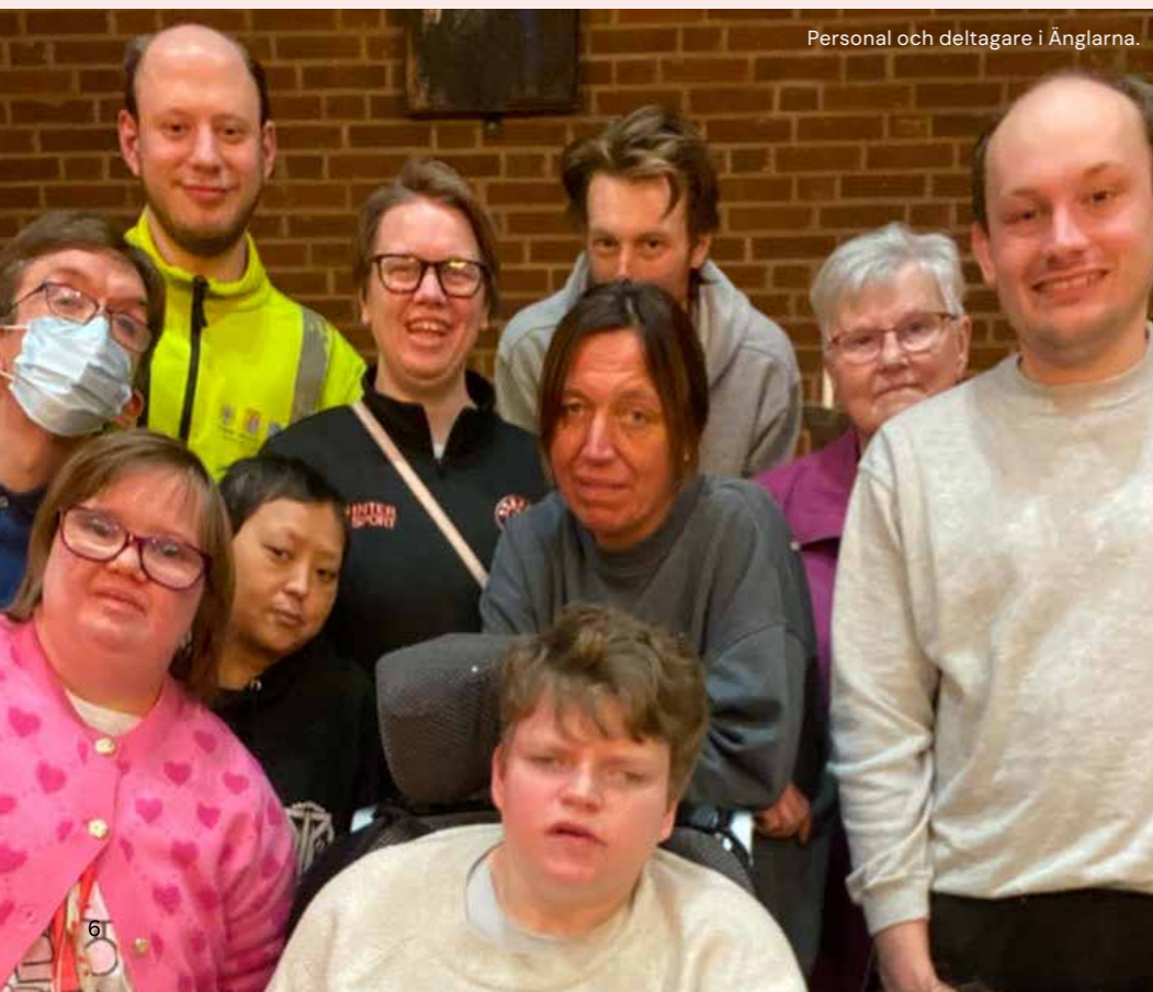
Personal och deltagare i Änglarna.

"Du vet väl om att Du är värdefull" och "Glöm inte bort att Änglarna finns".