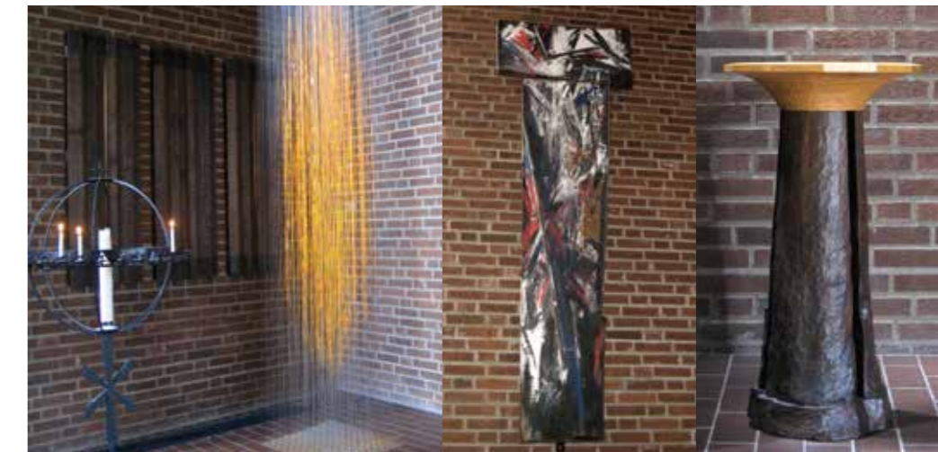
"Brinnande buske" av Saimi Kling, ▲ Lidingö.

Krucifixet är tillverkat av Erwin Wortelkamp. Dopfunten är tillverkad av Per Brandstedt. Den tolvkantiga formen som håller skålen anknyter till de tolv lärjungarna och den tredelade fotens insida har en kärna av guld. ▼