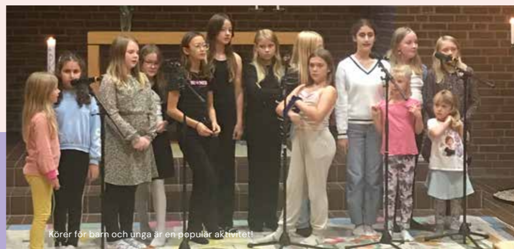
Körer för barn och unga är en populär aktivitet!