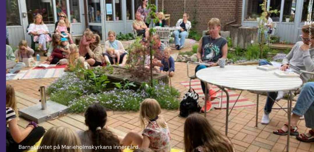
Barnaktivitet på Marieholmskyrkans innergård.