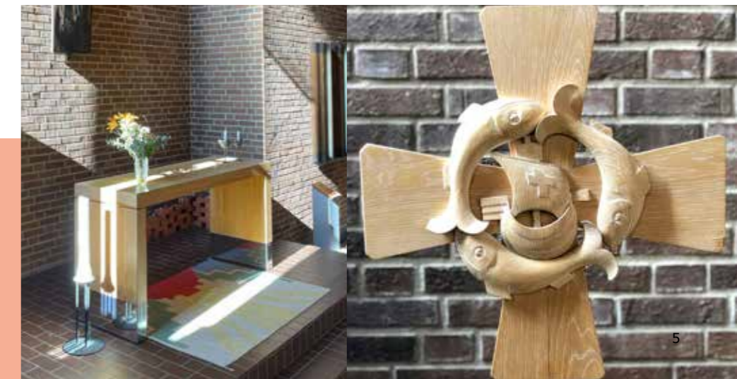
Processionskorset av Gösta Qvist från Töreboda efter skisser av H.E. Hanser och L.J. Ekelöf. ▼