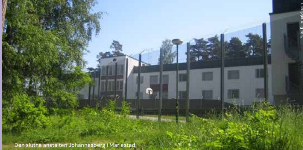
Den slutna anstalten Johannesberg i Mariestad.