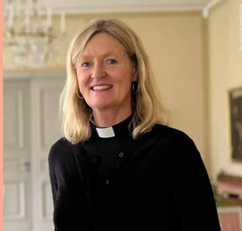
Text och foto: Josefim Roos