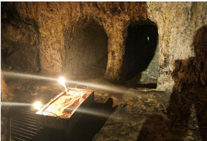
Gravar från första århundradet i ett kapell i östra delen av Gravkyrkan/Uppståndelsekyrkan i Jerusalem. Gravarna visar hur Jesu grav måste ha sett ut.

teokrati (Gudsstyre) där översteprästerna hade den religiösa och politiska makten, även om landet under denna tid var ockuperat av det romerska imperiet. Jesus talade alltså på högsta politiska och religiösa nivå när han var i Jerusalems tempel och framförde budskapet om Gudsriket som ska komma till jorden. Genom Guds dom ska världen ändras – det ska bli ett rättvisare samhälle där de som lidit och varit