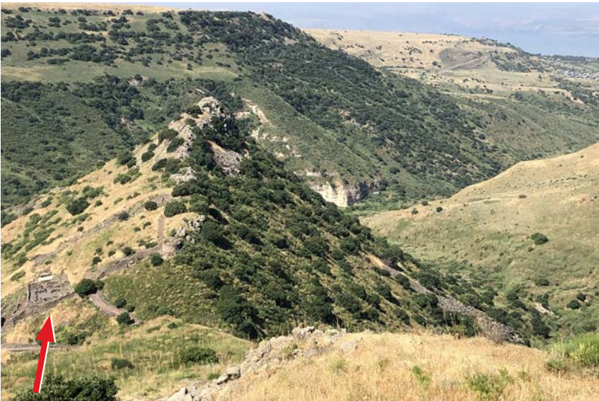
Synagogan i staden Gamla, som betyder kamel på hebreiska, ligger på en avsats i berget. I bakgrunden syns Genesarets sjö.