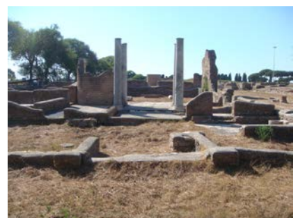
Synagoga från år 50–100 e Kr i Ostia utanför Rom.

I Galileen där Jesus predikade fanns just den här andra typen av synagogor. Jesus talade i de lokala kommunhusen och sedan fortsatte han till Jerusalem för att tala i templet som var det nationella maktcentrumet. Under Antiken gjordes ingen skillnad på religion och politik och Israel var en