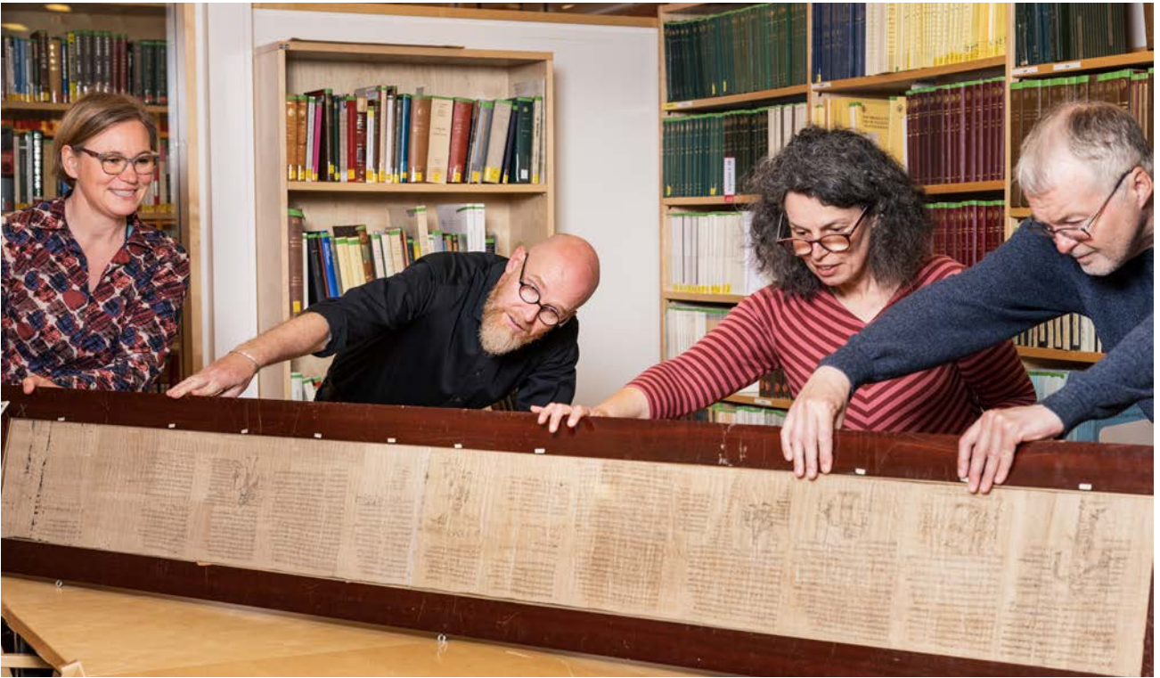
Undersökning av papyrustext som förvaras i biblioteket på universitetet i Oslo.