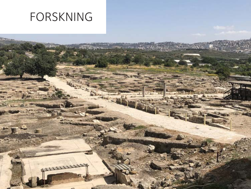
Utgrävning i maj 2022 i Sephoris som var en av de stora städerna i Galileen på Jesu tid. Josef och Jesus kan ha arbetat som hantverkare här. På berget i bakgrunden ligger staden Nasaret.

I slutet av 300-talet blev kristendomen romarrikets statsreligion, och därmed politiserades budskapet på ett nytt sätt, inom ett icke-judiskt imperium. Allt sedan dess har kyrkorna skiftat mellan att vara politiska och mer opolitiska, beroende på hur kyrkornas ledning har velat positionera rörelsen. Det kan kännas konstigt idag, men kristendomen finns inte på grund av sina ledare – det är kyrkfolket som har bu-rit och bär kristendomen.