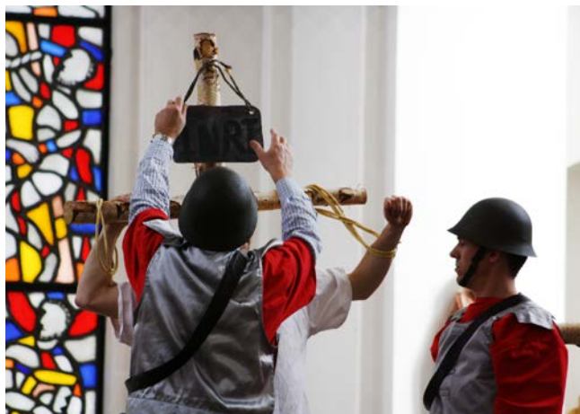
Foton från tidigare års påskdramer.