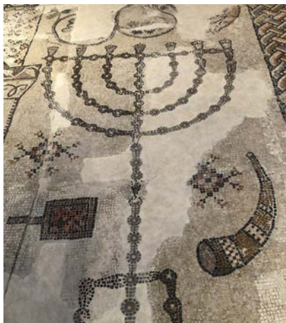
Mosaikgolv cirka 400–600 e Kr, från synagogan i Beth Shean i Galileen. Det är osäkert om synagogan är judisk eller samarisk.

I slutet av 300-talet blev kristendomen romarrikets statsreligion, och därmed politiserades budskapet på ett nytt sätt, inom ett icke-judiskt imperium. Allt sedan dess har kyrkorna skiftat mellan att vara politiska och mer opolitiska, beroende på hur kyrkornas ledning har velat positionera rörelsen. Det kan kännas konstigt idag, men kristendomen finns inte på grund av sina ledare – det är kyrkfolket som har bu-rit och bär kristendomen.