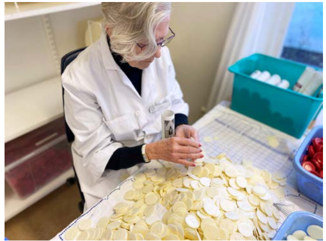
Packning av oblater i rör av ekologisk papp.