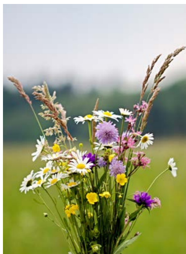
Sju sorters blommor.

Midsommarhelgen är en högtid med både kyrkliga och folkliga traditioner. Tro-ligen har Skandinaviens kalla, långa vintrar spelat en stor roll för högtidlighållandet av midsommarens ljus, värme och grönska.