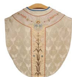
Mässhake av vit sidendamast från Hästveda kyrka.

Nattvarden är en glädjens högtid, med hopp och ljus. Vi förenas i en gemenskap där vi tar emot de himmelska gåvorna. På samma sätt som vi delar det himmelska så måste vi också dela det jordiska brödet rättvist med varje medmänniska. Välkommen till kyrkan, välkommen till nattvarden! Det är den uppståndne Kristus vi tar emot. Han ger sin seger till oss. För dig utgiven, för dig utgjutet.