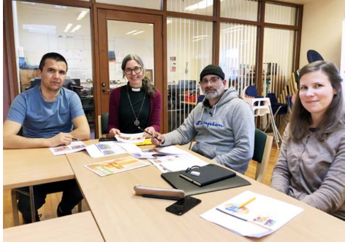
Deltagare i Språkcaféet.