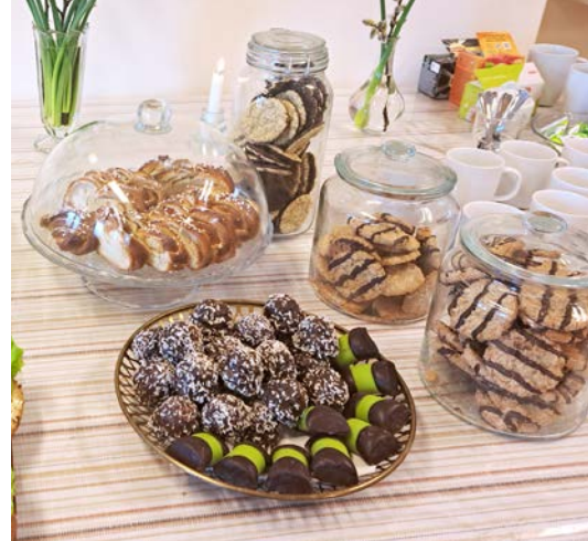
Vi umgås över en kopp kaffe, goda frallor och kakor.