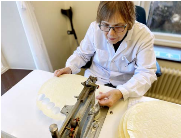
Oblaterna stansas ut och faller ner i en tygklädd låda.