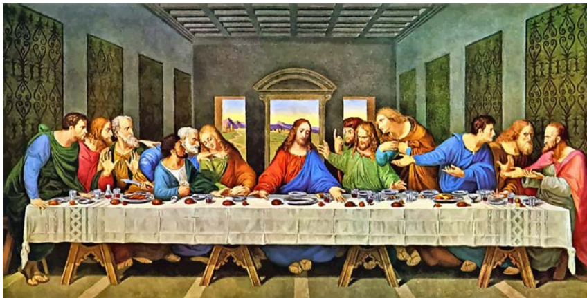
Jesus instiftar nattvarden. Replik av Leonardos väggmålning "Nattvarden" från 1490-talet. Den finns i matsalen i klostret Santa Maria delle Grazie, Milano.

Sockenbudstyg i tenn från 2002, Hästveda kyrka. Sockenbud är när prästen kommer på besök för firandet av enskild nattvard t ex i hemmet eller på sjukhuset.