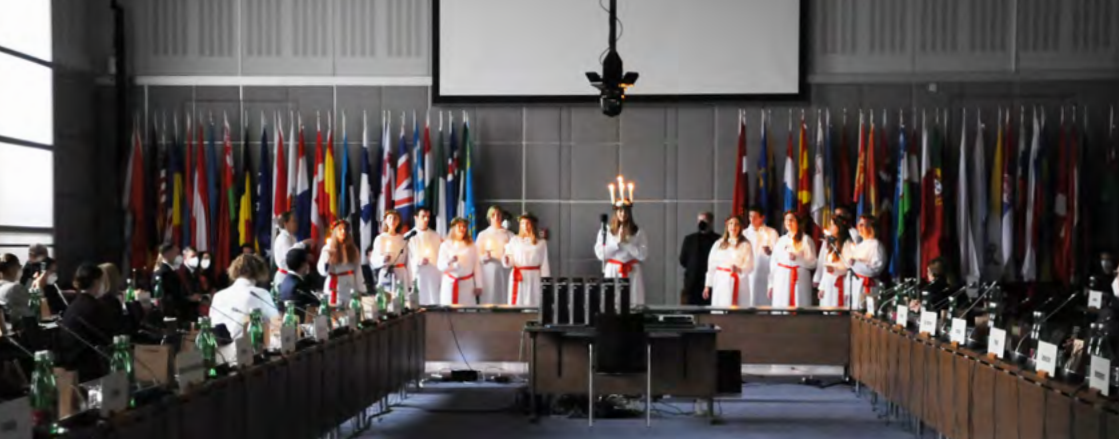
Luciafirande på Hofburg i Wien.

Kyrkokören har bara haft möjlighet att öva under två kortare perioder under höstterminen – men ändå fick vi äran att framträda med ett luciatåg under ett OSSE-rådsmöte i Hofburg. Det blev ett mycket uppskattat sånginslag, ett fint tillfälle att visa svensk kultur under mötet, och en viktig bekräftelse för svenska kören.