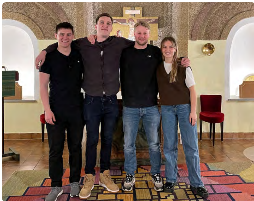
Praktikanter från Umeå universitet

Det starkaste minnet vi tar med oss från vår tid på S Häferl är först och främst de varma människorna som arbetar där. Det vi upplevt som unikt med organisationen är att det inte existerar någon tydlig hierarki eftersom vi upplever att arbetet där utförs av människor som finner det meningsfullt med ideellt arbete, vilket bidrar till en hjärtlig stämning där alla tillsammans arbetar mot samma mål – att ge mat och diverse tillgängliga artiklar till de som behöver det.