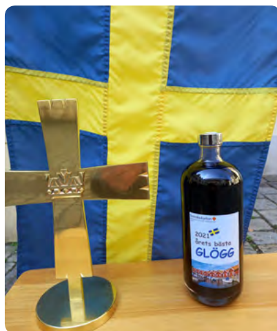
Kristna och världsliga jultraditioner möts på Gentzgasse

Nu går vi mot påsk Kyrkans största högtid. Även den uppmärksammas med marknad och gudstjänster. Kom och köp! Kom och hör hur det gick för julens bäbis när han blev vuxen! Kom till din kyrka - ofta!