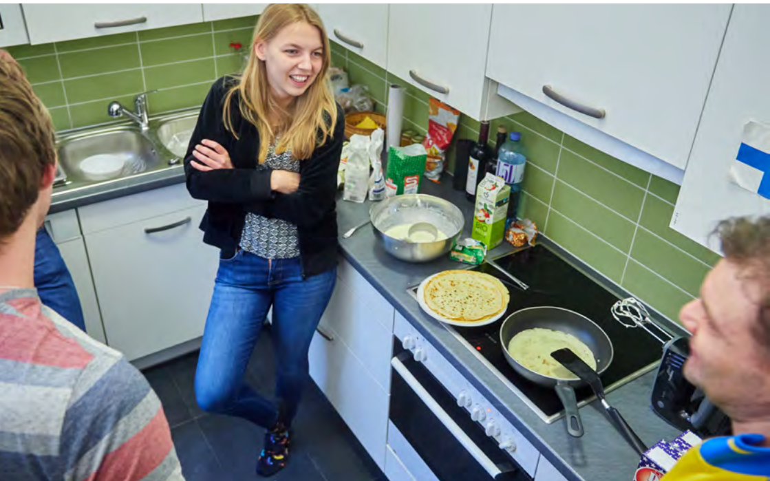
Ung i Wien träffas den 10:e varje månad och pratar, fikar, spelar spel m.m.