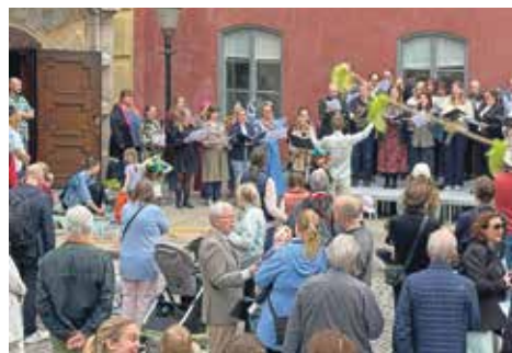
"Sköna maj, välkommen. Till vår bygd igen!" Valborg firades stort med en stor kör, lek och mingel. Ett fyrfaldigt leve för den evigt unga våren.