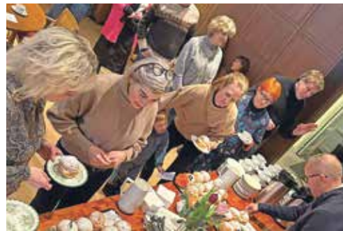
I år firades Fettisdagen i både Oslo, Stavanger, Bergen och Trondheim. Det har sjungits, quizats och sammanlagt har frivilliga och husmor bakat och serverat över 300 samlor.