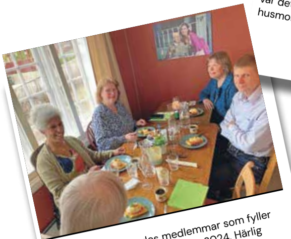
I Trondheim firades medlemmar som fyller jämnt eller halvjämnt under 2024. Härlig stämning, god mat och ett knivigt quiz.