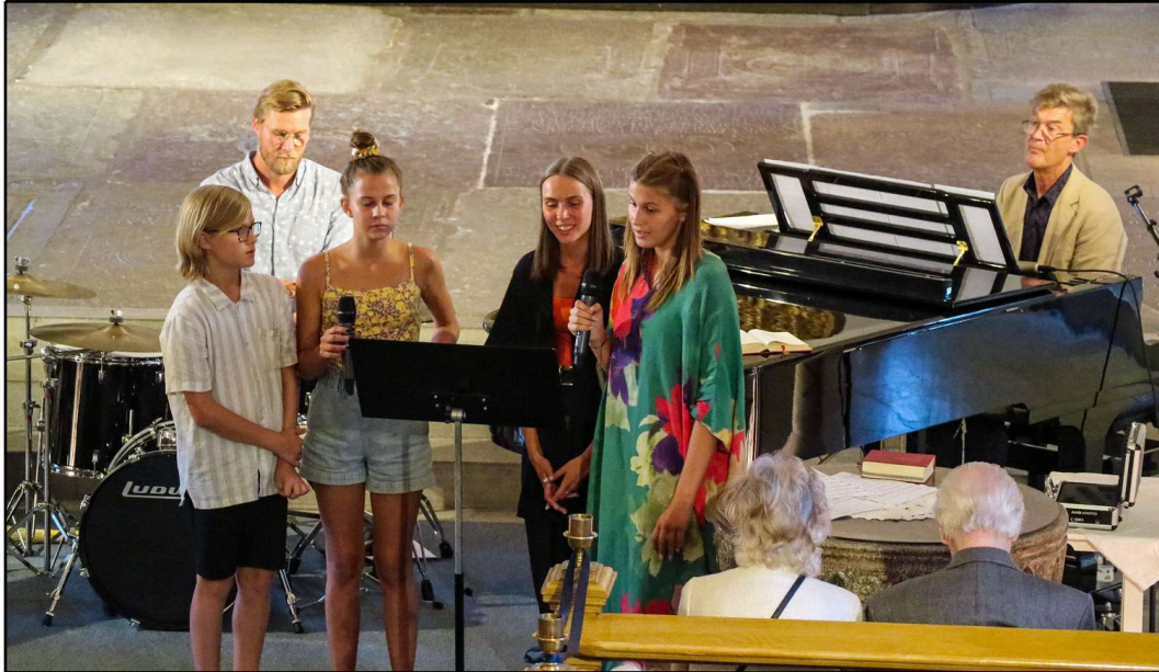
Familjen Östling avslutade Sommarkvällsmusiken för 2021 i S:t Laurentii kyrka.