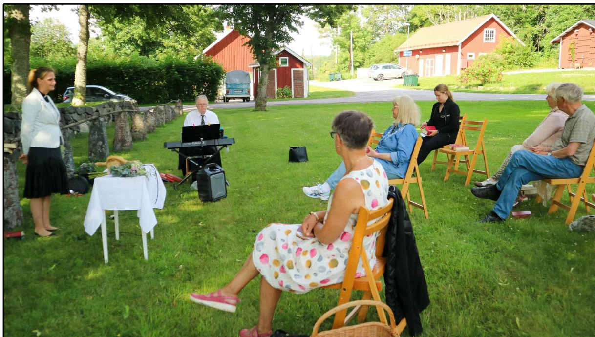
Friluftsgudstjänst vid hästräcket utanför Skällviks kyrka på midsommardagen 2021. Folkhälsomyndighetens rekommendationer är som synes uppfyllda.