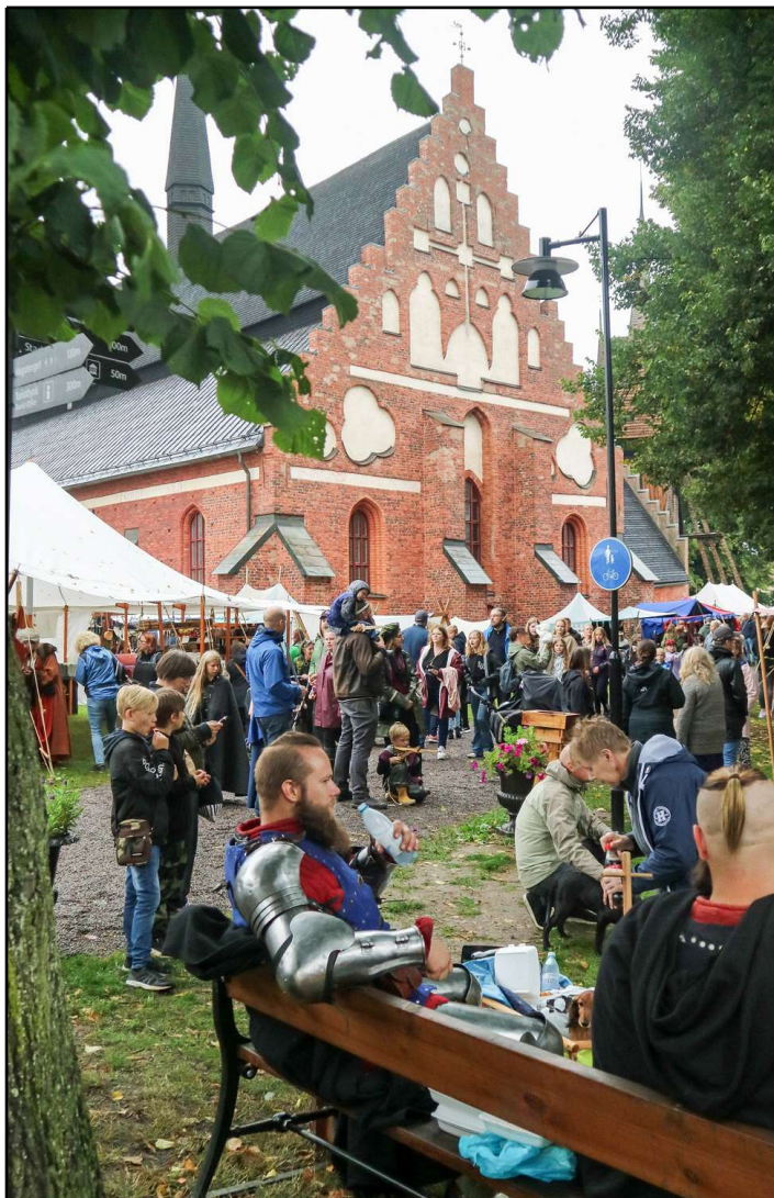
Trots nästan ett konstant regnande under de tre första dagarna Söderköpings gästabud pågick (26-29 augusti 2021) var det som synes många som ändå sökt sig till kyrkparken där den mesta av kommersen pågick.

Församlingen kommer även 2022 att engagera sig i Gästabudet om tillfälle ges. Församlingen engagerar sig bland annat i kyrkparken, vid Klockaregården med diverse aktiviteter.