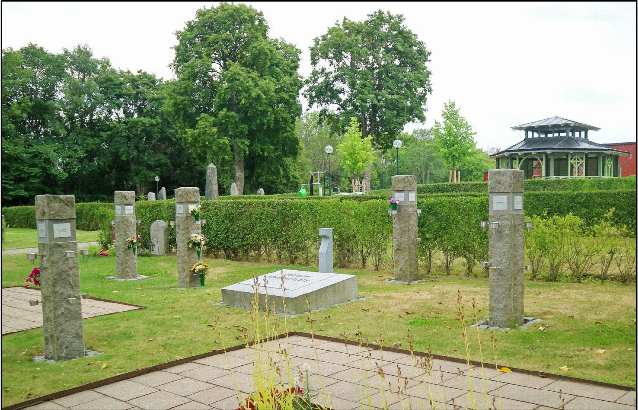
Askgravplatsen på Drothems kyrkogård sommaren 2021.