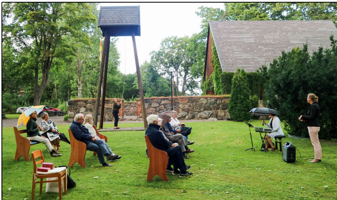
Friluftsgudstjänsten i Predikare-Lenas spår började utanför S:t Anna gamla kyrka men fick till slut flytta in i kyrkan på grund av regnet. Det var för övrigt där som Predikare-Lena fick en uppenbarelse under sin första nattvard. Tidigare gudstjänster på temat Predikare-Lena har hållits i Nygård nära torpet Mellankärr där Lena föddes år 1784.

Uppföljning, utvärdering och avrapportering sker till musikverksamhetsansvarig kontinuerligt efter varje termin, projekt.