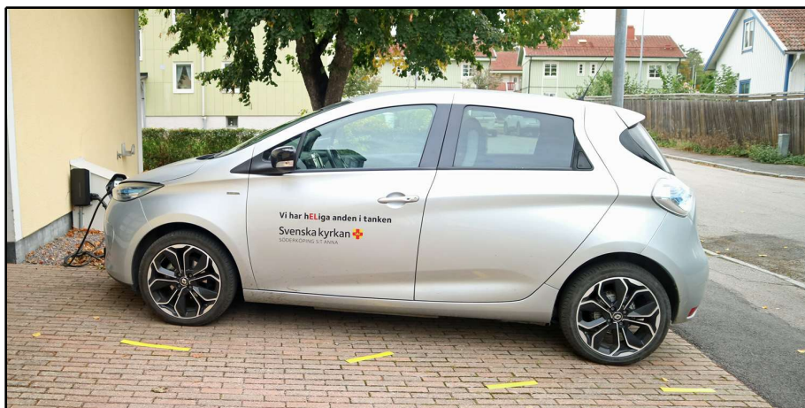
El-bilen vid sin laddstolpe.

I november 2022 går vårt nuvarande avtal ut och ett nytt skall tecknas för ytterligare 3 år.