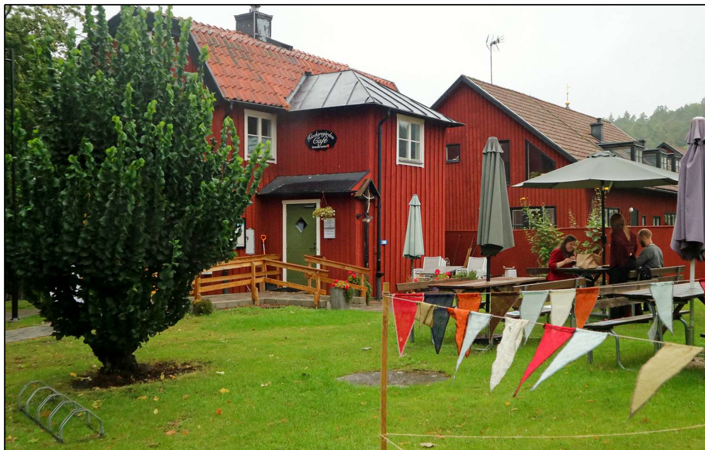
Klockaregården under Söderköpings gästbud pandemiåret 2021.