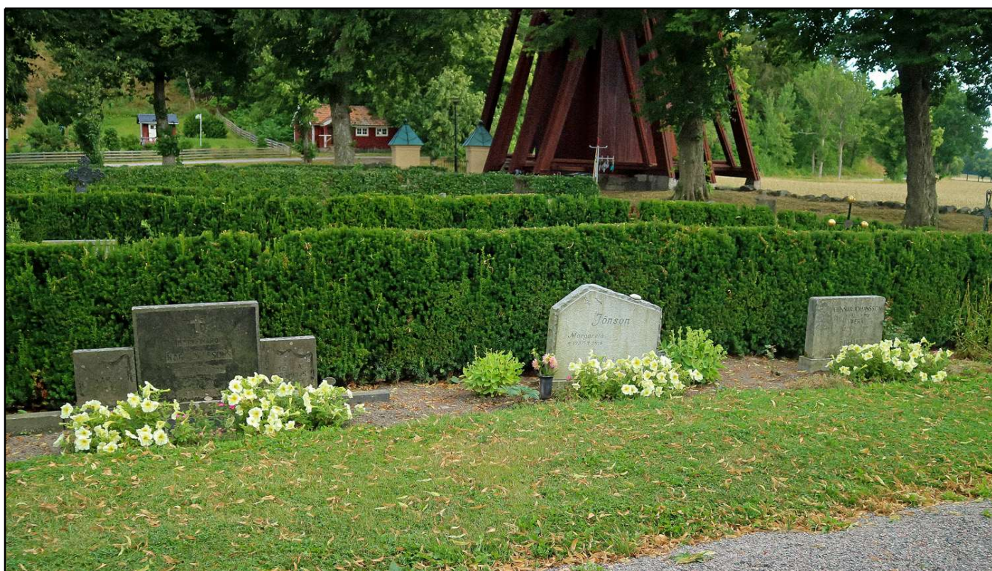
Ljusgula petunier var en vanligt förekommande prydnadsblomma vid gravarna under sommaren 2021 i Söderköping S:t Anna församling. Här ett exempel från Skällviks kyrkogård.