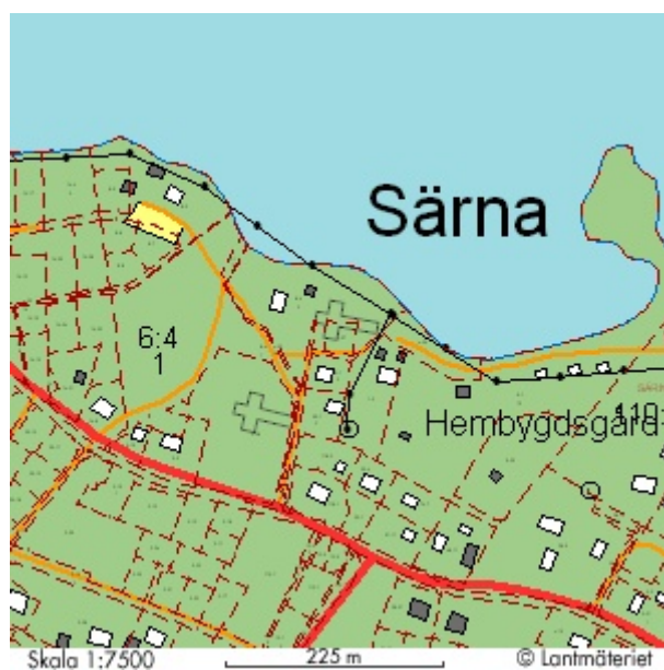
Särna gamla och nya kyrka, även prästgården