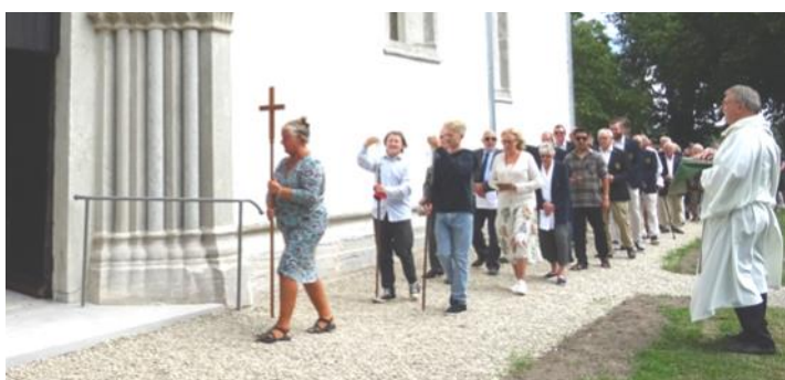
Bildkavalkad från återinvigningen av Tofta kyrka den 21 juli. Ovan: Samling och ingångsprocession. Till vänster: Vignvattenbestänkning av predikstolen. Nedan: Mingel i bygdegården. Se även bilderna på första sidan och sid. 3!