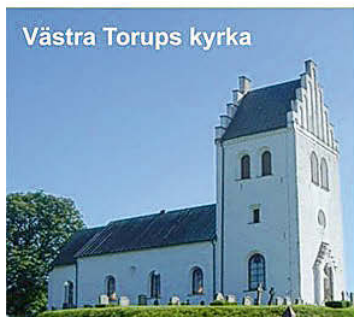
Västra Torups kyrka