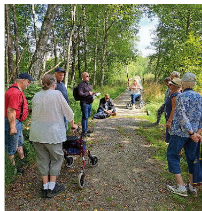
Vandringsgudstjänst i Västra Torup.

Frågor Kontakt: Eleanor Sander 070 570 9490