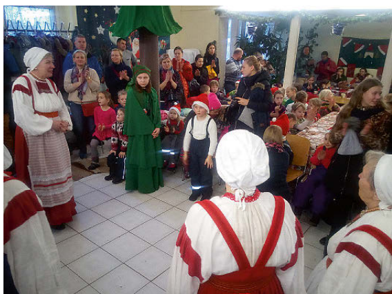
Julfest i vår vänförsamling i Ingermanland, Toksova.