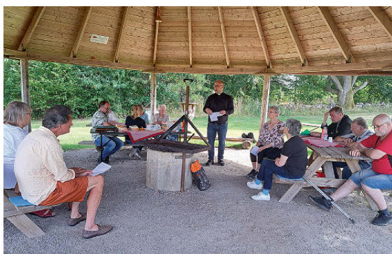
Vandringsgudstjänst i Västra Torup.