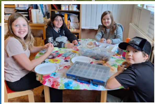
Utflykt med syföreningen i Kärda